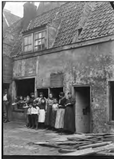
Afbeelding 5 Overbevolkte krotwoningen in de Jordaan, circa 1913