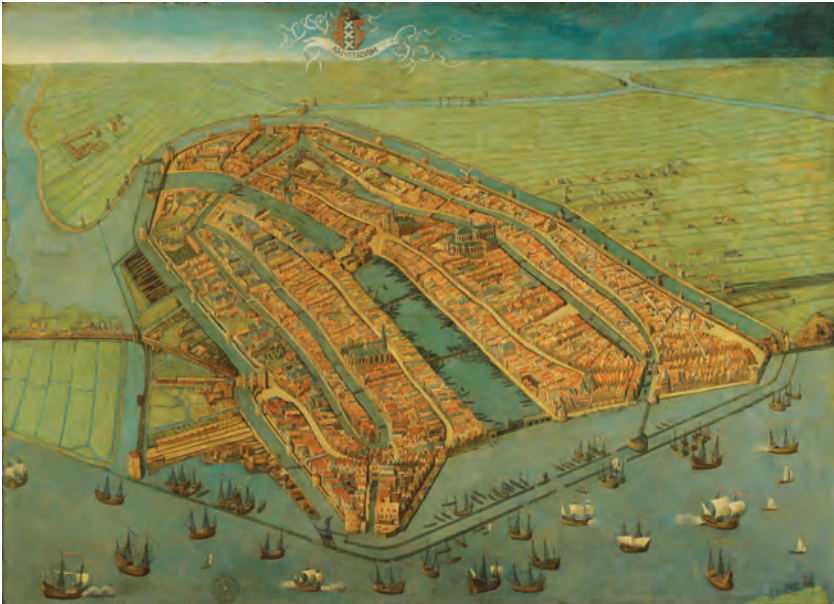
Afbeelding 3 Gezicht op Amsterdam in vogelvlucht, Cornelis Anthonisz, 1538

Het is een veelgehoord misverstand dat Amsterdam pas aan het einde van de zestiende eeuw, door de instroom van uit het Zuiden afkomstige handelaars ‘ineens’ tot de wereldhandelsmetropool is geworden die we allemaal kennen. Aan deze ontwikkeling ging een proces van ongeveer honderd jaar vooraf, waarin de stad al aan een enorme groei onderworpen was, die we echter in het stedelijk weefsel nauwelijks kunnen herkennen. Als we naar het vogelvluchtschilderij van Cornelis Anthonisz uit 1538 kijken (afb. 3), dan lijken we een statische stad te zien, die in grote mate ‘af’ is, maar dit beeld is bedrieglijk. Nog maar kort daarvoor had het stadsbestuur eindelijk een begin weten te maken met de definitieve versterking van Amsterdam. Na de brand van 1452