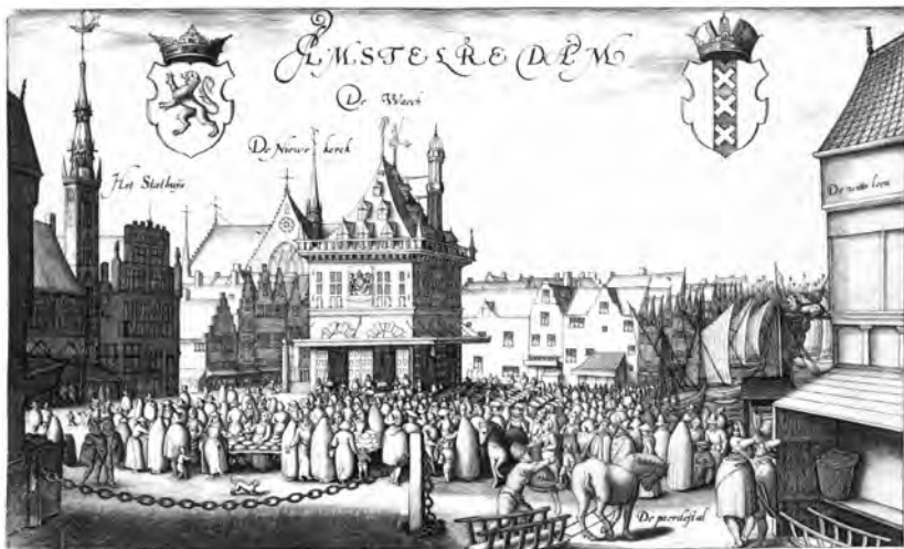
Afbeelding 4 De Dam rond 1570, met op de voorgrond de boter- en kaasmarkt