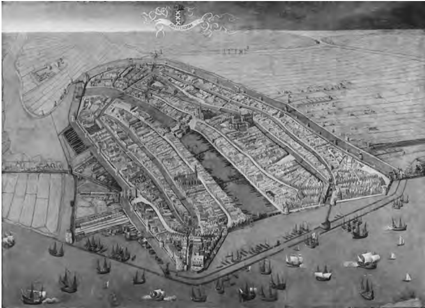
Image 3 Bird's eye view of Amsterdam, Cornelis Anthonisz, 1538

It is an oft-heard misconception that at the end of the 16th century, Amsterdam 'suddenly' started to flourish and became the global trading metropolis we all know due to the influx of traders from the south. This development was preceded by an approximately one-hundred-year process in which the city experienced enormous growth which can, however, scarcely be made out in the urban fabric. If we examine the bird's-eye view painted by Cornelis Anthonisz in 1538 (Image 3), then we seem to be viewing a static city that is, to a large extent, 'complete', yet this impression is misleading. Only shortly before this, the city council had finally started definitively converting buildings into stone structures. Although attempts had been made after the 1452 fire to have citizens build in stone, Amsterdam was still a wooden city around 1520. It proved difficult to motivate the city's inhabitants to invest in their homes and build in a more durable manner. This changed in 1521. Aided by an imperial decree, building in stone was vigorously implemented. Administrative tools were created by appointing the first municipal building master in 1524,