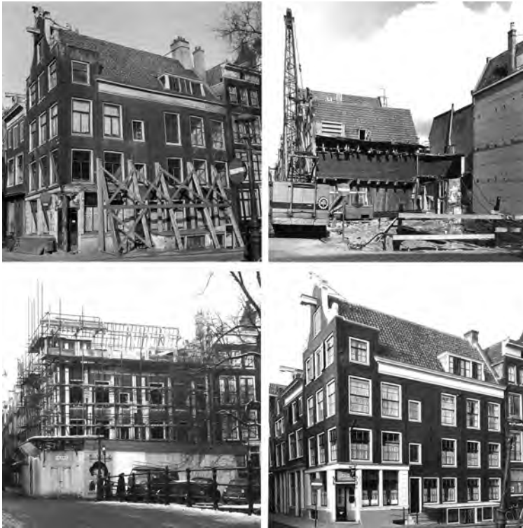
Afbeelding 6 Reestraat 2/hoek Keizersgracht in 1957, 1969 en 1970

De suggestieve kracht van oude gebouwen is groot genoeg om ons ervan te overtuigen dat we iets echt zien. Maar, zoals architectuurhistoricus Kees Peeters het eens zo mooi formuleerde: ‘Het oudste is het mooiste als wij het zelf gemaakt hebben.’ 40 We worden wat dat betreft soms verschrikkelijk voor de gek gehouden. Wie in Amsterdam loopt, ziet op elke hoek wel een oud gebouw. Maar met wat speurwerk wordt al snel duidelijk dat de hoek Vijzelgracht/Prinsengracht, de Reestraat/Keizersgracht, de Nieuwe Kerkstraat/Amstel niet tot het verre verleden teruggaan, maar in feite producten zijn van de na-oorlogse beweging die het oude stadsbeeld in stand wilde houden (afb. 6).