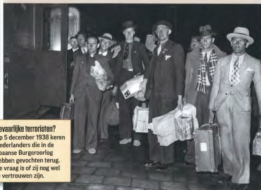
Gevaarlijke terroristen? Op 5 december 1938 keren Nederlanders die in de Spaanse Burgeroorlog hebben gevochten terug. De vraag is of zij nog wel te vertrouwen zijn.

voorwendselen zijn geronseld door pionnen van Stalin, zo heette het, om vervolgens willoos te worden geïndoctrineerd door de communistische leer. Niemand wist als wat voor personen zij zouden terugkeren, maar dat ze zouden weten hoe ze wapens moesten hanteren stond vast.