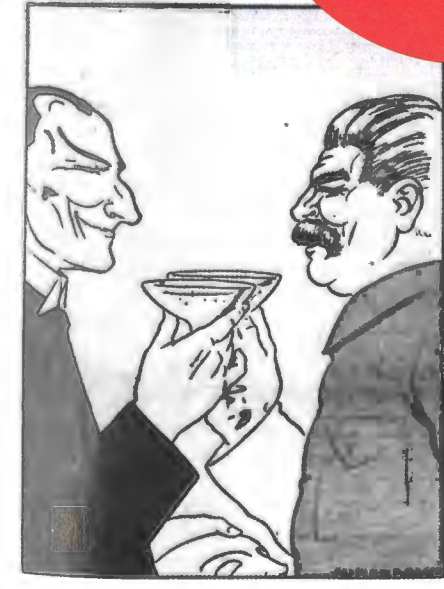
Volgens deze prent uit NSB-krant Volk en Vaderland uit juni 1938 toast Stalin (rechts) met de gemaskerde dader.

WANTROUWEN ALLE NIET-NEDERLANDERS ZIJN AUTOMATISCH VERDACHT