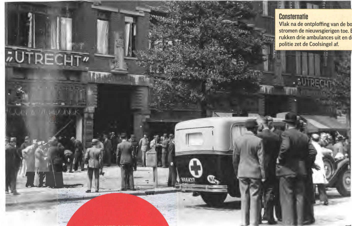
Consternatie Vlak na de ontploffing van de bom stromen de nieuwsgierigen toe. Er rukken drie ambulances uit en de politie zet de Coolsingel af.

WANTROUWEN ALLE NIET-NEDERLANDERS ZIJN AUTOMATISCH VERDACHT