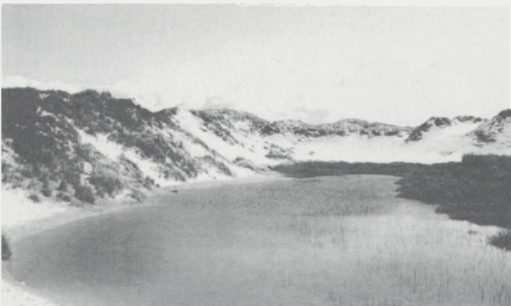
Als de grondwaterspiegel stijgt worden verstuiwingen vastgelegd, maar er kun-nen ook prachtige natte duinvalleien ontstaan (foto: John van Boxel).

beschikbare voedingsstoffen. Het gevolg is een vergrassing en verruiging van de duinvegeta-ties. Daardoor ontstaan er minder nieuwe ver-stuivingen en groeien bestaande verstuiwingen sneller dicht. Zo dreigt de verstuiwing, een voor het duingebied karakteristieke landschapsvorm, te verdwijnen. Daarom zijn duinbeheerders op grote schaal overgegaan tot het kunstmatig initiëren van verstuiwingen, met wisselend succes.