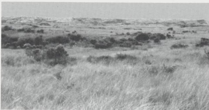
Door de vergrassing en verzuivering verdwijnen de karakteristieke verstuivingen uit het duingebied.