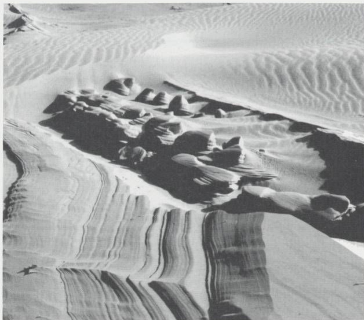
In de voor het duingebied karakteristieke verstui-vingen ontstaan de meest fan-tastische vormen.

arm aan voedingsstoffen. Door de hoge doorlatendheid van het zand verdwijnt de regen snel in de bodem. Op de laaggelegen stukken is het zand lang vochtig en daar ontwikkelden zich in het voedselarme milieu vaak bijzondere vegetaties. Op hogere delen komt vaak droogte voor, vooral op zuidhellingen, waar de zomerzon bijzonder fel kan zijn. Hier kunnen stuifkuilen ontstaan, die eventueel uitgroeien tot groot-schalige verstuiwingen.