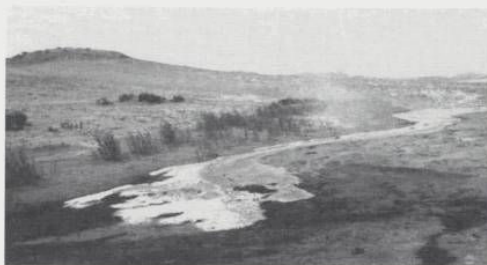
Als het te hard regent kan het water niet meer infiltreren, zelfs niet in het goed doorlatende duinzand.

Sinds de industriële revolutie zijn de concentraties van alle broeikasgassen sterk toegenomen. De kooldioxideconcentratie is met meer dan 35% gestegen door de verbranding van fossiele brandstoffen en het kappen van tropische regenwouden. Vrijwel alle meteorologen en klimatologen zijn ervan overtuigd dat de stijgende concentraties broeikasgassen het klimaat op aarde nu al beïnvloeden. Het KNMI heeft aangetoond dat de wereldwijde temperatuurstijging in de 20e eeuw voor ongeveer 0,2 °C werd veroorzaakt door natuurlijke oorzaken, zoals variaties in zonnestraling, vulkanisme en El Niño. Het grootste deel (0,7 °C) komt door het versterkte broeikas effect.