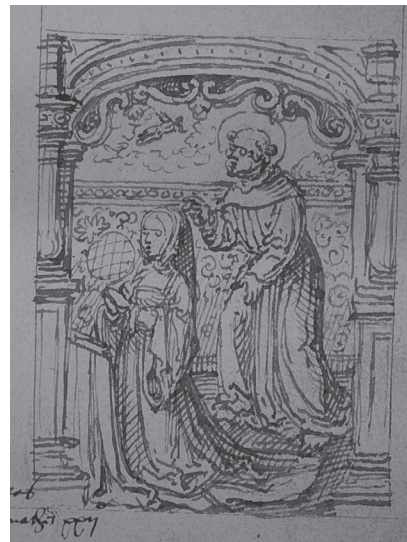
Afb. 1a-b-c: Details van de tekening van een glasraam voor de pandgang van Scheut met daarop aangegeven hoe de schenkers en hun wapenschilden moesten worden afgebeeld. MBZB, dossiernr. 245 f. 89. Achter de geknielde ridder staat Johannes de Doper, achter zijn vrouw de heilige Franciscus. Hun namen zijn nog onbekend, hun wapens nog niet geïdentificeerd

durige verwijdering tussen vader en zoon. Bovendien koos Isabella van Portugal partij voor haar zoon en trok zij zich vanaf die tijd terug op haar kasteel te Motte-au-Bois. 23 Ondanks het conflict wijst het itinerarium van vader en zoon er op dat zij gedurende langere periodes tegelijkertijd in Brussel aanwezig waren: van januari tot en met maart, in juni en in oktober 1457; en in mei en juni 1458. In die laatste maand was Philips ziek geworden en heeft Isabella hem opgezocht te Brussel. 24 Het is verleidelijk om de schen-