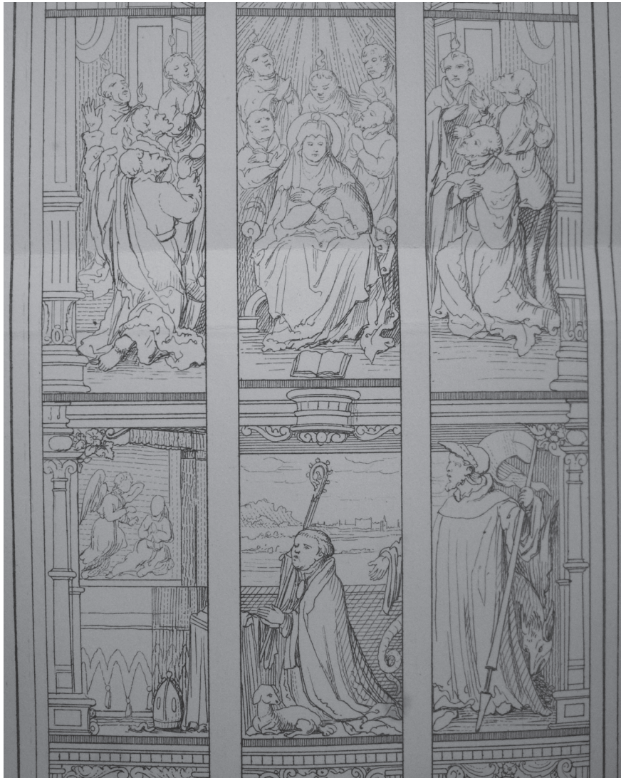
Afb. 5: Tekening van een glasmaam met de nederdaling van de Heilige Geest, geschonken door Willem van Brussel, abt van Sint-Truiden, voor de nieuwe kerk van Scheut. Achter Willem van Brussel staat zijn patroon de heilige Wilhelmus van Maleval (afb. uit: A. Pinchart, Archives des arts, sciences et lettres: documents inédits III , Gent 1881)