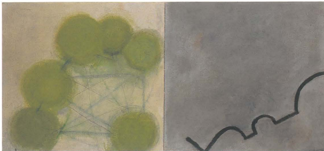
Dorien Melis: En route, 1997; acryl op paneel, 31x68 cm