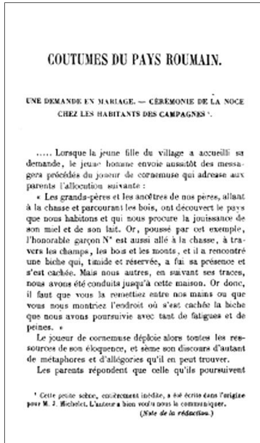
Fig. 4. „Revue de l'Orient”, t. XV (1 janvier 1854), p. 173 (Biblioteca Națională a Franței).