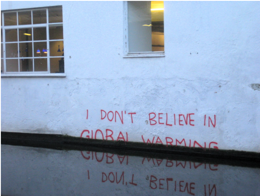
Figure 1. Graffiti from 2009 by Banksy in Camden, North London, UK.

marginalised groups. 12 The stories of indigenous peoples that increasingly play a role in archaeological research are an example in case. 13 It seems that, currently, there is peaceful coexistence between ‘academic’ and ‘alternative’ archaeologies. Both form communities of insiders and outsiders and there is little exchange between them. 14 This leads to the coexistence of alternative and even conflicting versions about the past. 15