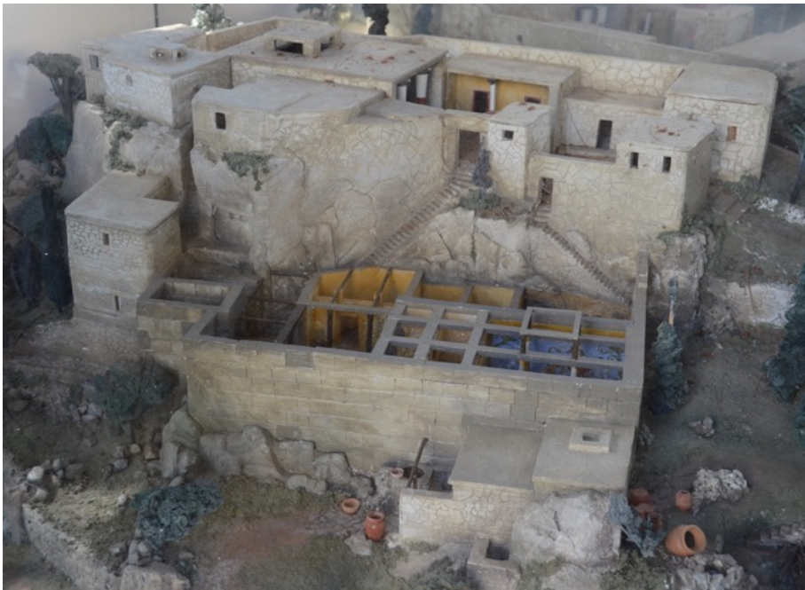
Figure 3. Model at Stavros on Ithaki showing a reconstruction of the palace of Odysseus as excavated by L. Kontorli-Papadopoulou and Th. Papadopoulos at Aghios Athanasios. Created by M. Mazzali.

It appears that in terms of the search for Homeric Ithaca, no clear division can be made between professional and non-professional archaeology. Despite the fact that only professional archaeologists can actually conduct excavations, this did not play a role in the production of knowledge and the extent to which it was accepted. Indeed, because of the incorporation of external scientific expertise, the attraction of media attention and the manner of publication, it was the outsider Bittlestone's work which seems to have had the most impact.