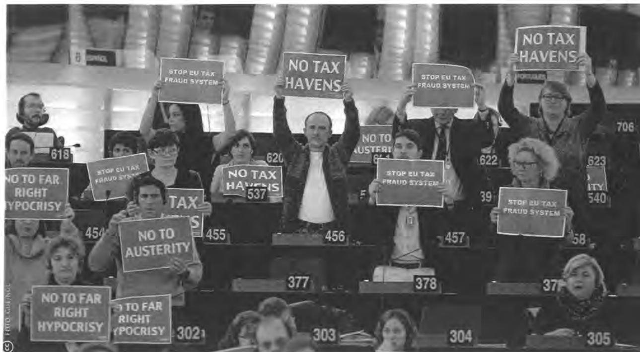
De net benoemde EC-voorzitter Jean-Claude Juncker overleefde op 27 november 2014 een motie van wantrouwen in het Europese Parlement naar aanleiding van de LuxLeaks. Vooral European United Left/Nordic Green Left, waarin onder andere de Nederlandse SP deel van uitmaakt, protesteerde heftig.