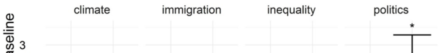
Figuur 1. Gemiddelde toename hartslag per film (Lowlands)

Onze analyses sluiten uit dat opwinding veroorzaakt wordt door alcohol, drugsgebruik, leeftijd, opleiding en politieke kennis. De opwinding is gemiddeld wel hoger bij vrouwen dan bij mannen.