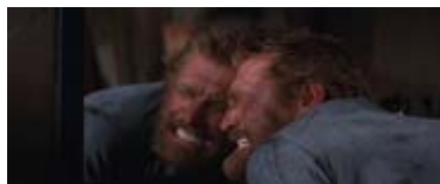
Figure 5 & 6. Miroir, cadre, cache