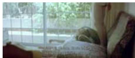
Figure 11 & 12. Coup de fil

En fin de compte, le clin d'œil chez Travail et culture doit être interprétée du point de vue de l'éducation populaire. Le réalisme peut alors effectivement être un nouveau médium au potentiel expressif, à con-