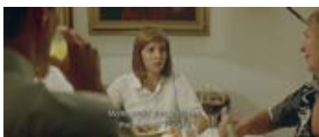
Figure 9 & 10. “téléphone” = sel