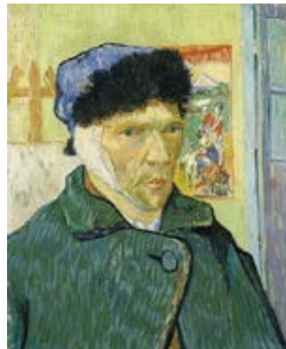
Figure 2. Autoportrait... (Van Gogh, 1889)