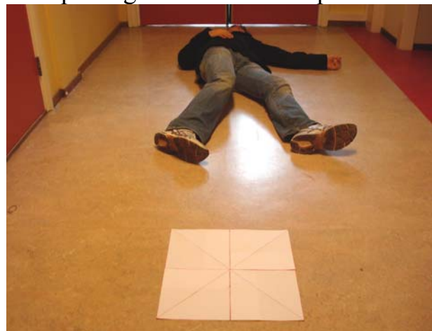
Foto van de plaats van delict.

spectiefvierkant is het enige object op de foto waarvan de werkelijke afmeting bekend is en zal gebruikt worden om de grootte en de onderlinge positie van de andere objecten te bepalen. Zo'n hulpmiddel is nodig omdat je het slachtoffer op de foto in perspectief ziet. Afmetingen en posities zijn vertekend. Hierdoor heb je geen eenvoudige afstandsrelatie tussen de objecten en kun je de afmetingen niet simpelweg met een liniaal opmeten.