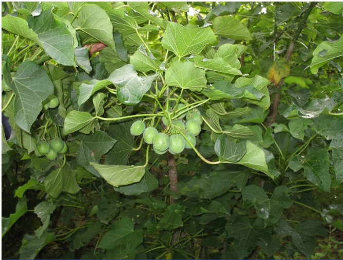
Jatropha curcas . Struik met oliehoudende vruchten, geschikt voor teelt in droge warme klimaatzones. Sterk in opkomst in India en Zuidelijk Afrika.

voordeel van biomassa is dat het naast energiebron ook energiedrager is. Dat wil zeggen dat de energie zit opgeslagen in een (brand)stof die kan worden opgeslagen en meegenomen. Hét voorbeeld van een energiedrager zonder koolstof is waterstof. Dat moet echter eerst geproduceerd worden en daar is de duurzaamheid dus afhankelijk van de oorsprong van de energie die gebruikt wordt om de waterstof te produceren.