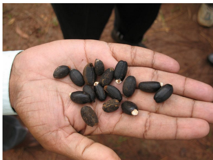
Zaden van de Jatropha curcas . Hieruit wordt olie gewonnen die gebruikt kan worden als alternatief voor bijvoorbeeld dieselolie. Jatropha is geschikt voor teelt in droge warme klimaatzones. Sterk in opkomst in India en Zuidelijk Afrika. De zaden op deze foto komen uit Zambia.

Over het algemeen zijn biobrand-stoffen, vanwege de omslachtige omzetting van zonlicht in chemische energie en vanwege de relatief grote hoeveelheden energie en materialen die nodig zijn in het productieproces, niet bepaald energie-efficiënt. Toch zijn sommige biobrandstoffen populair, vooral de vloeibare vormen, omdat het feit dat het ook energiedragers zijn ze tot een gemakkelijk alternatief voor olieproducten in de transportsector maakt. Bio-ethanol en organisch ge-produceerde oliën zijn als vervangers van olie vaak zonder veel aanpassingen direct te gebruiken. Ethanol uit riet-suiker wordt vooral in Brazilië al op grote schaal gebruikt in de transport-sector. Voor gemotoriseerd vervoer