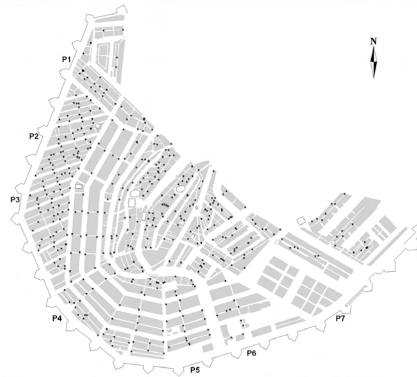
FIGUUR 4 Locatie van bakkerszaken, 1742

Voor dagelijkse behoeften als brood wenste ook de vroegmoderne consument immers geen grote afstanden af te leggen. 49