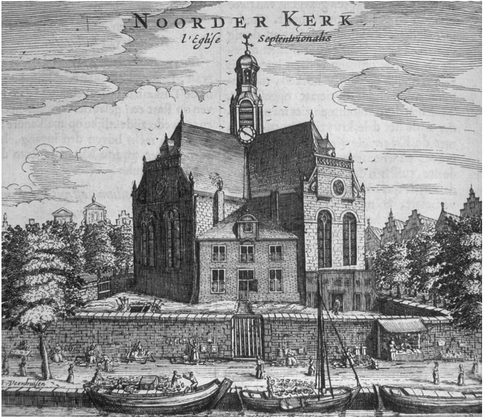
Markt aan de Prinsengracht ter hoogte van Noorderkerk en Noorderkerkhof. Bron: Tobias van Domselaer, Beschryvinghe van Amsterdam; haar eerste oorspronk etc (Amsterdam: Marcus Willemsz. Doornick, 1665).

Dam en langs de Kalverstraat. Een aantal radialen in de grachtengordel en de radiaal van de Dam in zuidoostelijke richting door Halsteeg (nu Damstraat), Oude Doelenstraat en Hoogstraat waren eveneens goed voorzien van dit type winkels. Op de Noordermarkt daarentegen, werd geen enkele winkel in deze branche aangetroffen en aan de Nieuwmarkt slechts één. Wel tekent zich op de kaart een concentratie af op de Prinsengracht tussen Tuinstraat en Egelantiersgracht. De boedelinventarissen die bij het faillissement zijn opgemaakt, wekken de indruk dat het hier om betrekkelijk marginale winkeltjes ging, hetgeen ook verklaart waarom er in het register van de Personele Quotisatie geen Franse winkelhouders en galanteriewinkeliers op deze locatie worden aangetroffen. 59