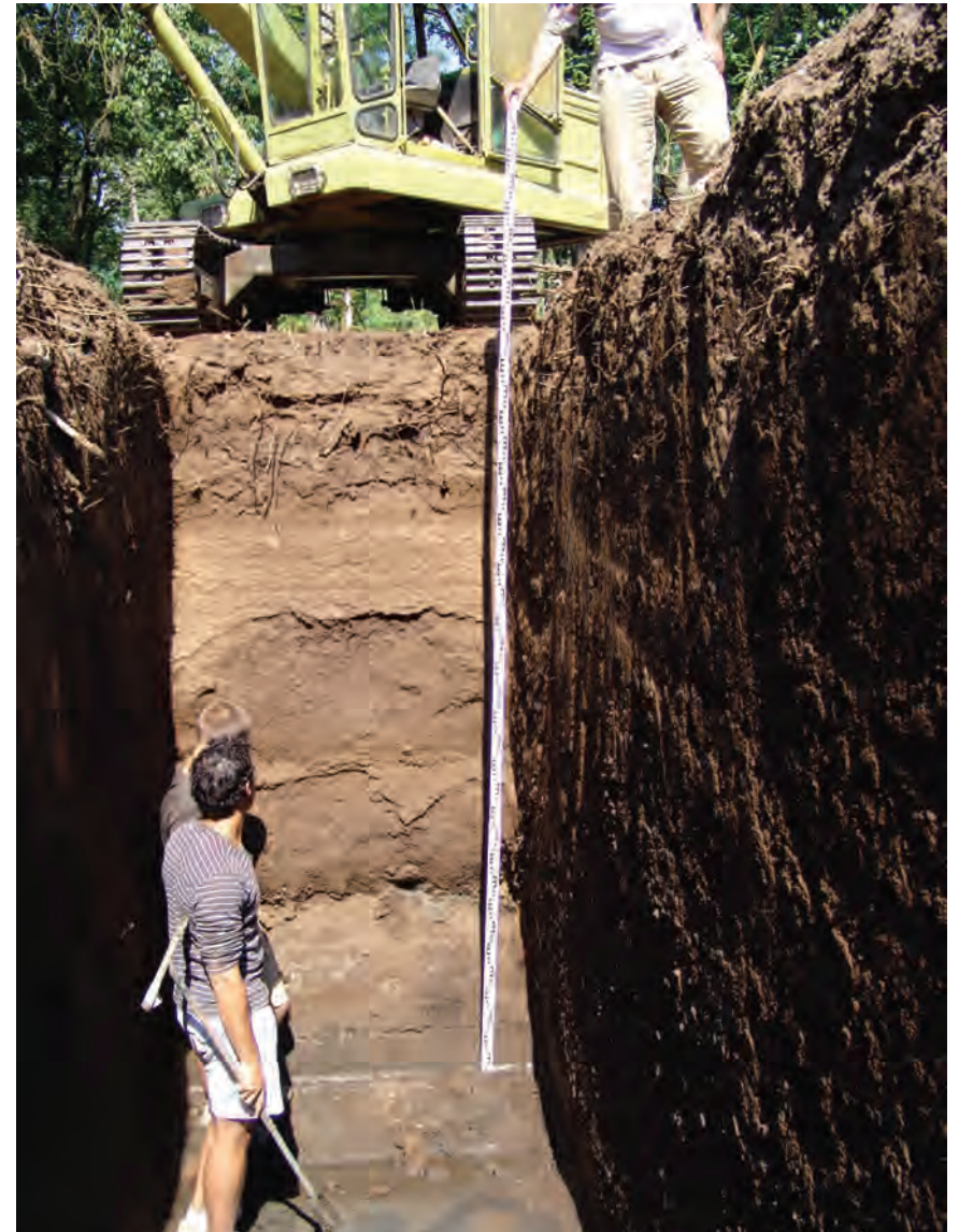
Fig. 5b Srato di terra riportata sopra il livello della palude