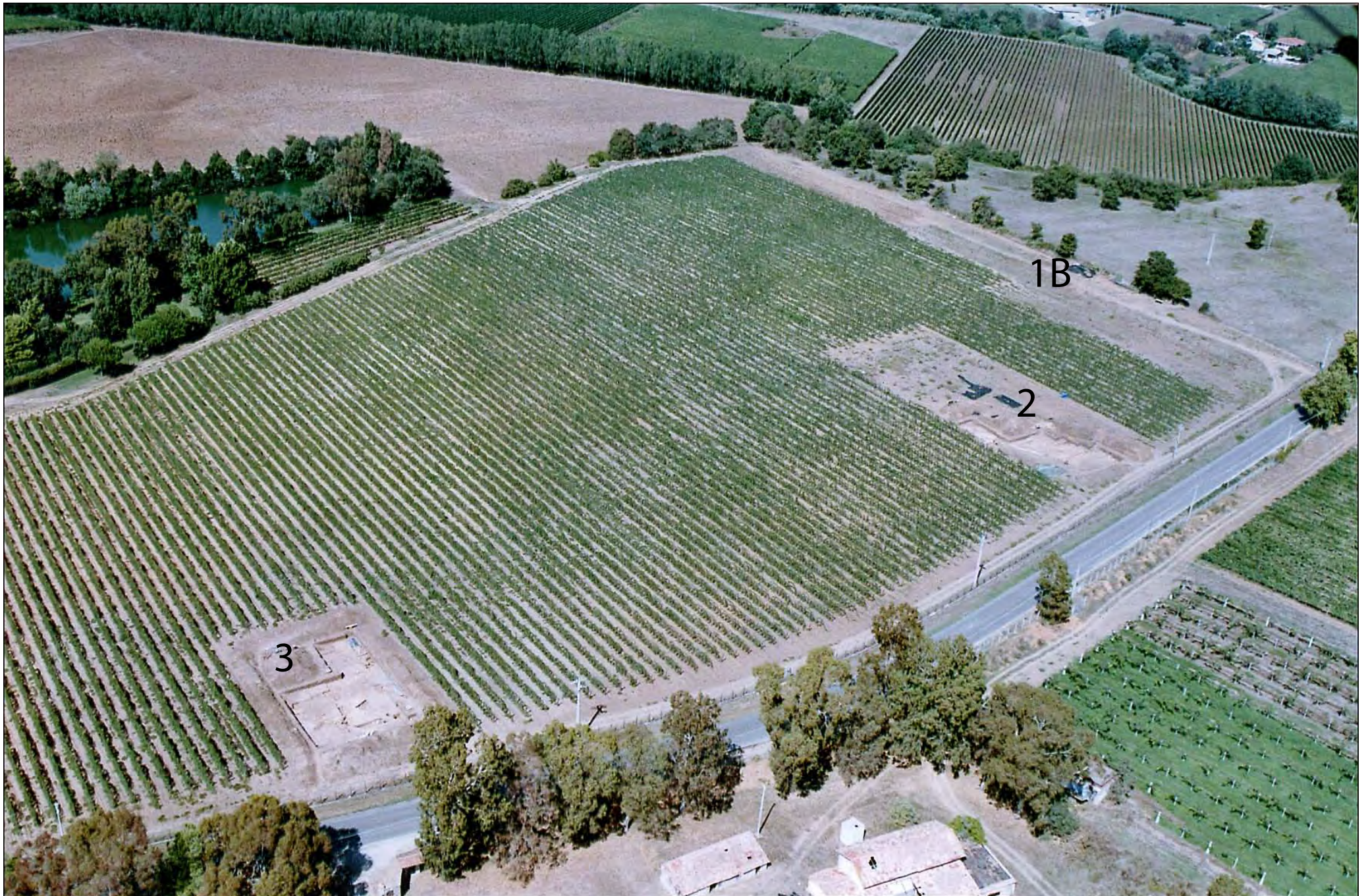
Fig. 1 Le Ferriere (Satricum) - Poggio dei Cavallari II: fotografia aerea dei campi di scavo