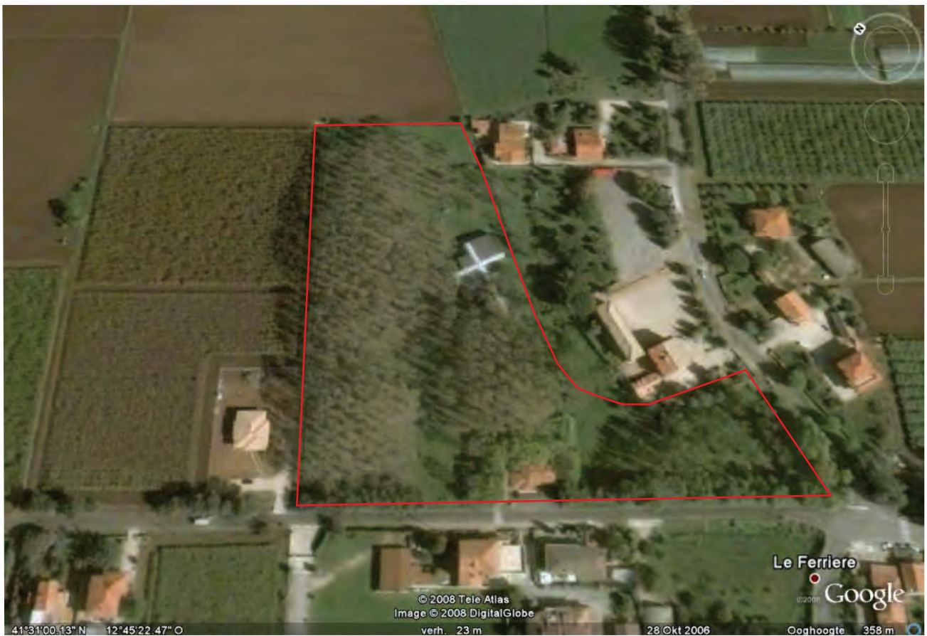
Fig. x Fotografia aerea del terreno del Santuario di Santa Maria Goretti; il terreno della ricognizione è delimitata dalla linea rossa