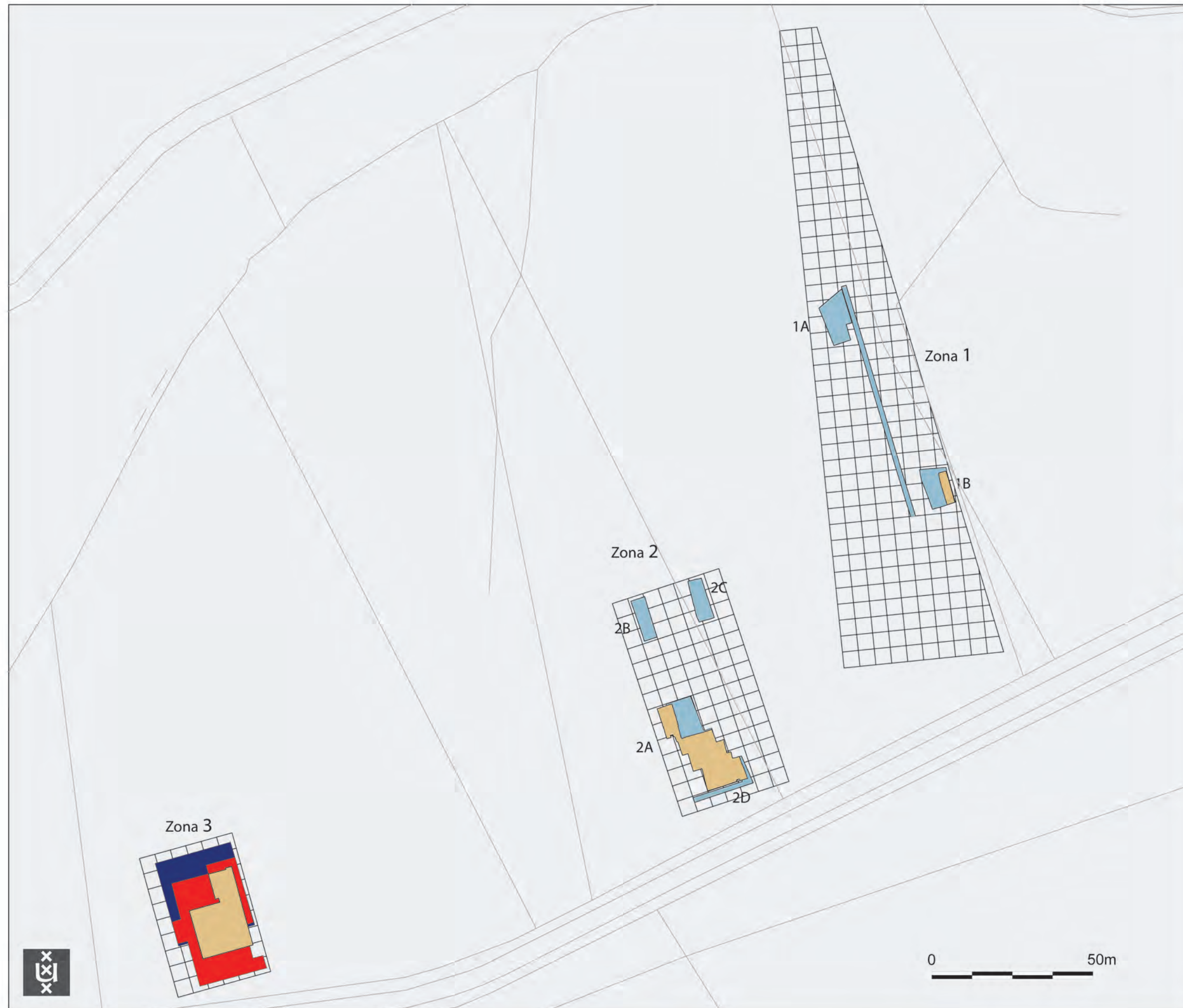
Fig.2 La pianta topografica del Poggio dei Cavallari II con indicazione delle tre zone di scavo