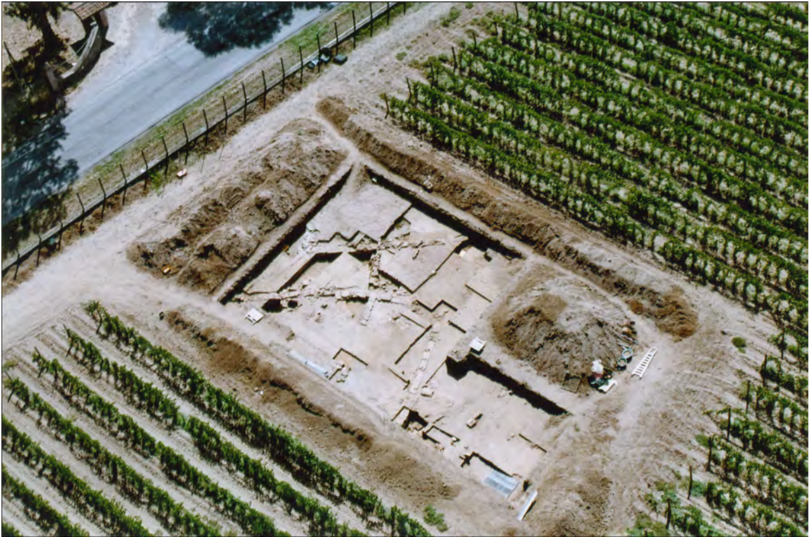
Fig.3a Campo di scavo 3 (2005) - Fotografia aerea da nord-est