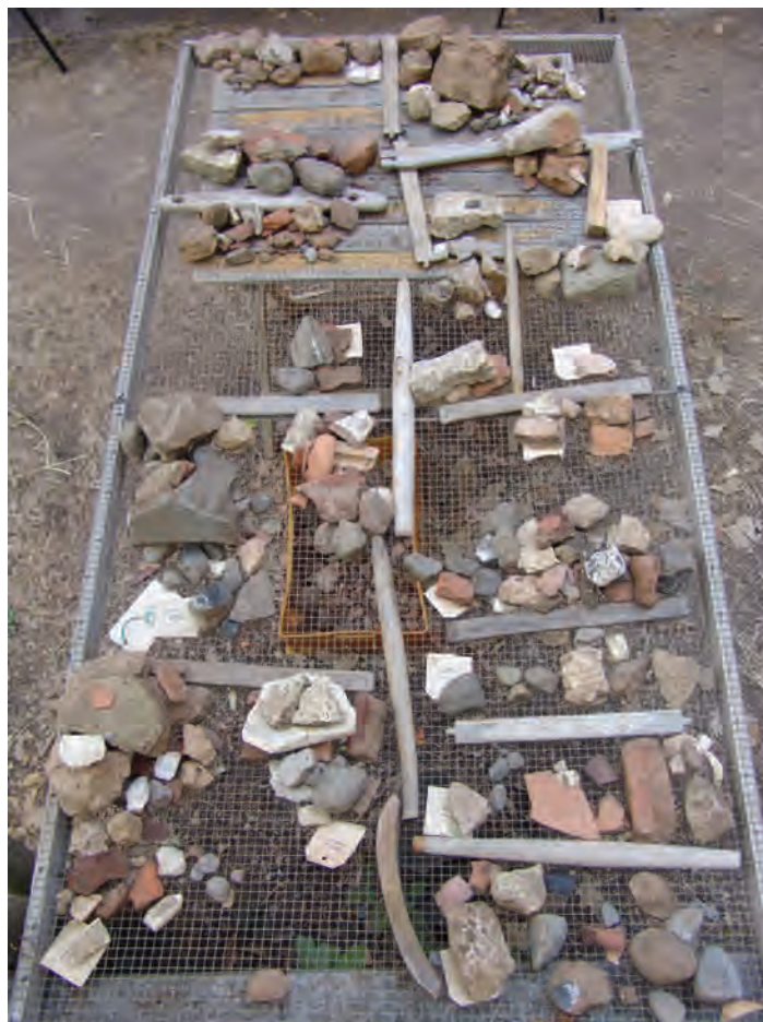
Fig. 6b Reperti archeologici dall'epoca arcaica trovati sul terreno del Santuario di Santa Maria Goretti