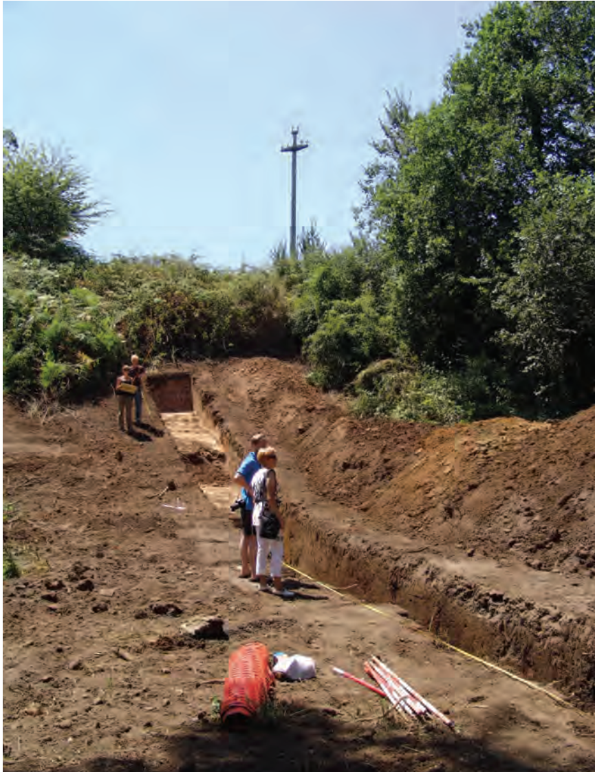
Fig. 5a Trincea al piede dell'Acropoli di Satricum (Le Ferriere)