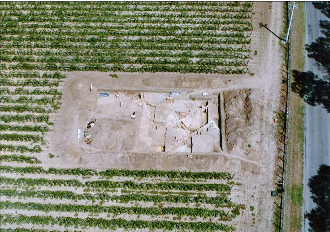
Fig.3b Campo di scavo 3 (2005)- Fotografia aerea da ovest