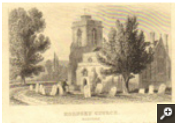
Saint Mary's Church van Hornsey, met kerkhof

leggen bloemen op het graf van De Schoolmeester in Horsney Grave Yard op 12 maart 2008