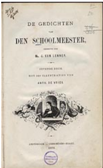
Titelpagina van De gedichten van Den Schoolmeester (1878)