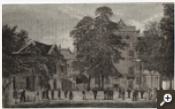
Achterzijde van Cromwell House (1861)