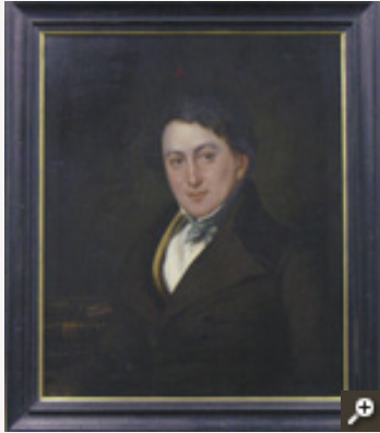
Portret van Gerrit van de Linde uit zijn studententijd (Letterkundig Museum, Den Haag)