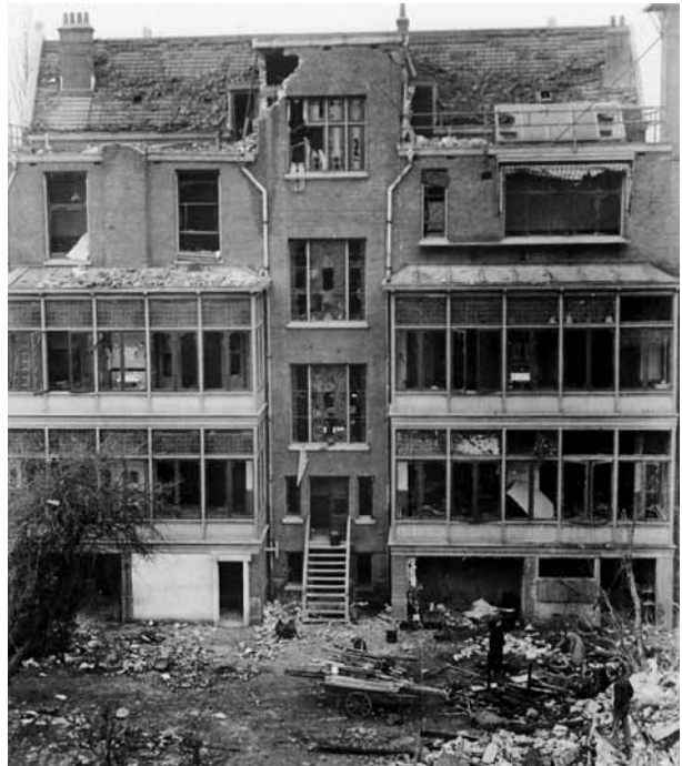
Achterzijde van de Rotterdamse Aussenstelle na het bombardement van 29 november 1944. Op 14 september waren in de tuin nog drie leden van het verzet door een executiepeloton doodgeschoten.

Het bombardement had weinig effect gehad, want de jacht op verzetsmensen bleef onverminderd doorgaan, terwijl tevens het grootste gedeelte van het archief bewaard gebleven was. Het verzet loerde op een kans om alsnog het uitgebreide archief te vernietigen en enkele arrestanten te bevrijden. Deze gelegenheid deed zich voor op 21 december 1944. Die avond zouden de meeste beampten in het Kasino van de Aussenstelle aan de Heemraadssingel 157