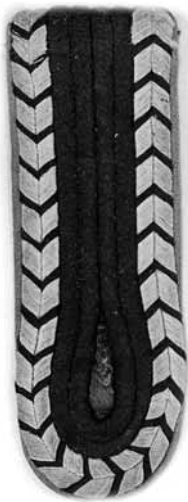
Mouwembleem en schouderstuk afkomstig van het uniform van een Nederlands lid van de Ordnungspolizei.