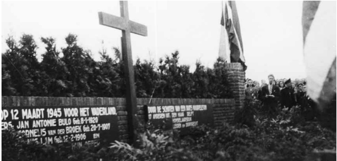
Eerste herdenkingsmonument aan de Pleinweg Later werd die monument vervangen door 'de Vallende Ruiters'.