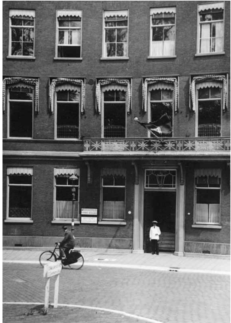
1942. Bureau van de 'Wasserschutzpolizei' en het 'Seemannsamt' aan de Veerkade 7.