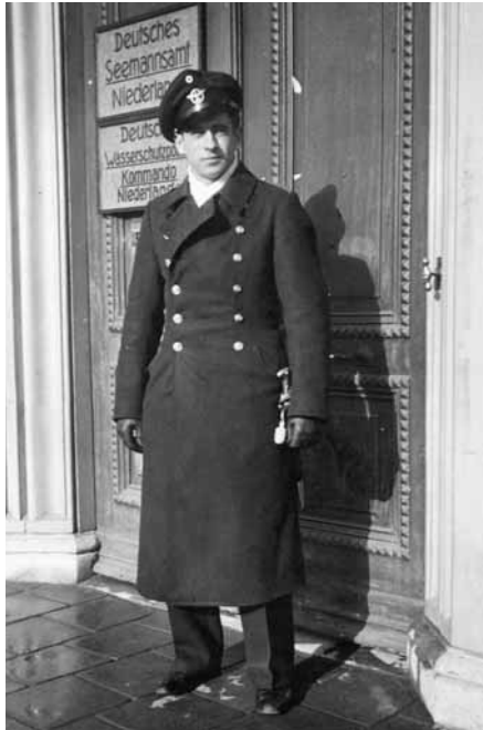
Wachtpost van de 'Wasserschutzpolizei' voor de ingang aan de Veerkade.