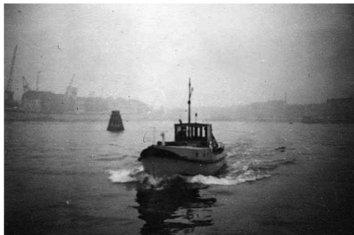
Patrouillevaartuig van de 'Wasserschutzpolizei' in de Rotterdamse haven. aan de Veerkade.