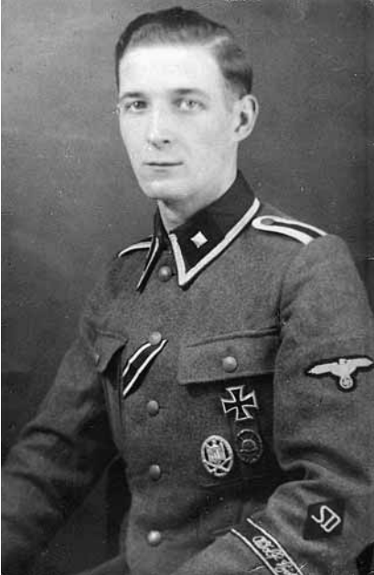
SD-beambte (SS-Unterscharführer) Röhmer werd op 5 maart 1945 samen met een Nederlandse SS'er op de hoek Goereessestraat/Pleinweg doodgeschoten.

Op 5 maart 1945 waren in Rotterdam-Zuid op de hoek Goereessestraat/Pleinweg een Duitse beambte van de SD Röhmer en de Nederlandse SS'er Koster doodgeschoten. Hoewel het voor de hand lag dat dit het werk was van het verzet, scheen dat deze keer niet het geval te zijn geweest. Deze aanslag was waarschijnlijk door een betrapte fietsendief gepleegd.