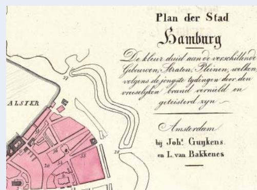
Dit kaartje laat zien dat ook de hele buurt rond en ten oosten van de St. Jacobi Kirche werd aangetast.

Het meest opvallend en karakteristiek voor Hamburg zijn de Binnen Alster en Aussen Alster, fraaie waterpartijen die door menselijk ingrijpen zijn ontstaan. Al in de 12de eeuw veroorzaakte de aanleg van een dam in de Alster een opstuwing van het water erachter, waardoor een kunstmatig meer ontstond. Sinds de 17de eeuw scheidt de Lombardsbrücke de Binnen en Aussen Alster van elkaar. Deze vormen zijn zó karakteristiek en herkenbaar, dat de Duitsers tijdens de Tweede Wereldoorlog de Binnen Alster met grote netten bespanden. Daarop was een fictief stratenpatroon afgebeeld om herkenning vanuit de lucht, vooral van het strategisch belangrijke spoor over de Lombardsbrücke, te bemoeilijken. Wij weten dat het niet heeft geholpen: het centrum van Hamburg is in de Tweede Wereldoorlog bijna van de kaart geveegd. Figuurlijk dan, want naoorlogse plattegronden van de stad laten zien hoe hardnekkig een stratenplan blijft voortbestaan, ook al is de derde dimensie praktisch weggevaagd. •