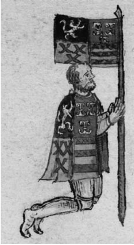
Afb. 2. Jacob van Gaasbeek getekend door A. Buchelius naar een glasraam in de domkerk van Utrecht. Jacob is geknield afgebeeld met zijn banier waarvan het eerste (Gaasbeek) en derde kwartier (Strijen) abusievelijk zijn verwisseld met het tweede (Abcoude) en vierde (Putten). Het gevierendeelde wapenschild weerspiegelt goed het prestigieuze bezit aan heerlijkheden van Jacob van Gaasbeek. A. van Buchel, Monumenta passim in templis ac monasteriis Trajectinae urbis atque agri inventa f. 7v. Utrecht, Het Utrechts archief (Bibliotheek), ms. XXVII L 1.

de heerlijkheden werden overgedragen. Zo kocht Anton van Croÿ begin jaren dertig de heerlijkheden Aarschot en Bierbeek voor 25.000 pond van zijn schoonvader, terwijl de heerlijkheid Wedergate, geen baandererij, ‘maar’ 3.600 pond kostte. 42 Hiermee samenhangend, en misschien van nog wel groter belang, was het aantal (leen)mannen dat een baanrots kon mobiliseren. Ook deze cijfers zijn echter moeilijk uit de bronnen te destilleren. Wel is bekend dat de heer van Gaasbeek rond 1475 maar liefst 180 mansscappen onder volle leene ende cleyne leenkens hield. 43 De vraag is of dat potentieel aan leenmannen ook daadwerkelijk in stelling werd gebracht door de baanrotsen.