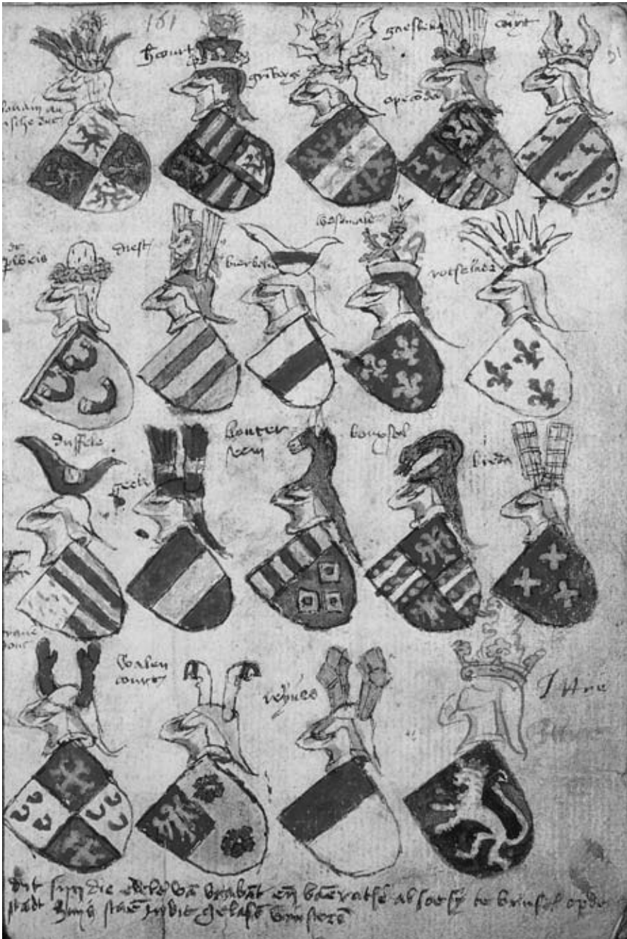
Afb. 3 Negenentien wapenschilden zoals ze vermoedelijk stonden afgebeeld in het stadhuis van Brussel in de eerste helft van de vijftiende eeuw. KBB ms. 6563 f. 91r.