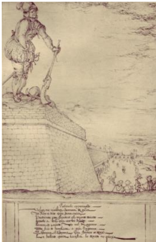
uit: Rob van Roosbroeck. Patientia , 24 Politieke emblemata door Joris Hoefnaghel (1569), Antwerpen 1935.

Deze vluchtelingen werden gedreven door economische, politieke en religieuze motieven, motieven die onlosmakelijk met elkaar verbonden waren. Het is interessant om te zien dat Hoefnaghel in zijn politieke emblemen over patientia ook Spanjaarden in penibele omstandigheden een stem geeft. Bijvoorbeeld Spaanse soldaten die over de kou en hun lijden in de Nederlanden klagen.