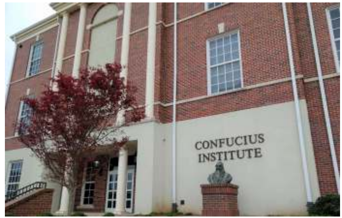
Het netwerk van de Confucius-instituten is een vorm van Chinese 'soft power'.