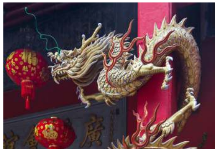
De huidige Europese aanpak is onvoldoende om de Chinese Draak te temmen.