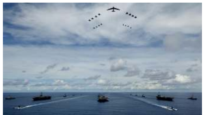
Trump heeft ook de militaire kracht van de VS ingezet om de handelsovereenkomst mogelijk te maken.