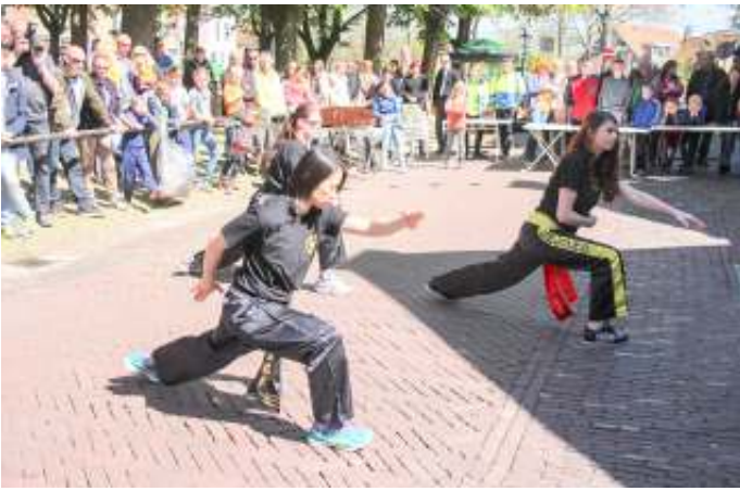
Er is wel een collectieve samenwerking met de Centraal- en Oost-Europese landen (CEE) in het BRI, het zogeheten '17+1 project' dat door Brussel met argusogen wordt gevolgd. Immers, een aantal landen van deze CEE-groep geldt als kandidaat-land, zoals Noord-Macedonië en Albanië en is recentelijk in de wacht gezet voor toetreding, omdat ze volgens Brussel te weinig structurele hervormingen doorvoeren. De ex-voorzitter van de Europese Commissie, Jean-Claude Juncker, heeft voor het verstrijken van zijn mandaat nog gezegd dat Chinese investeringen in de Balkan een slecht idee zijn omdat de noodzakelijke sociaaleconomische hervormingen in de Balkanregio worden vertraagd. De Balkanlanden zien dat toch wat anders. De Chinese investeringen en leningen onder gunstige voorwaarden om de gebrekkige infrastructuur te verbeteren worden in dit deel van de EU van harte welkom geheten. China is ook bereid om deze leningen te verstrekken op basis van de 'Beijing Consensus' die ervan uitgaat dat er aan investeringen en leningen, anders dan de financiële, geen voorwaarden mogen worden gesteld. In de praktijk betekent dit dat er geen Chinese inmenging plaatsvindt in de binnenlandse politieke verhoudingen. Dit is geheel anders dan het Europese toetredingsproces, waar men moet voldoen aan de Kopenhagen-criteria die voorschrijven dat alle Europese wet- en regelgeving in kandidaat-lidstaten van kracht moet zijn voordat deze landen kunnen toetreden tot de EU. De Europese procedures om aan geld te komen, zijn ingewikkeld en tijdrovend; de Chinese daarentegen zijn eenvoudiger en sneller.