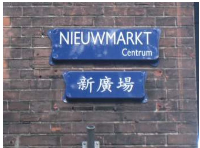
Chinese opschriften verschijnen inmiddels in de openbare ruimtes van veel Europese landen.

Zowel de individuele strategie van de West-Europese landen als de collectieve strategie van Centraal- en Oost-Europa verhinderen een gemeenschappelijk Europees optreden tegen China. De separate handelsovereenkomst tussen de VS en China laat ook zien dat de VS en de EU samen geen eenduidige Westerse China-strategie hebben. De verhoudingen worden uitdrukkelijk bepaald door particularisme. Ieder gaat voor zijn eigen kansen. Het is een illusie om te denken dat dat genoeg zal zijn om de Chinese Draak te temmen.