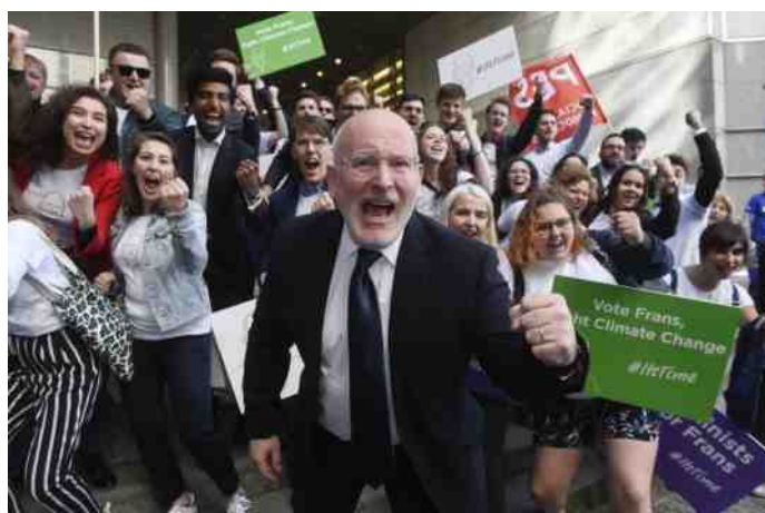
Velen in ons land hebben tot het laatste moment vurig geloofd in de kandidatuur van Frans Timmermans.