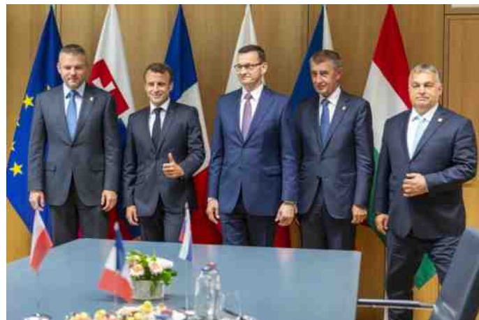
Macron smeedde een monsterverbond met de V4.

Von der Leyen heeft net als Macron aangegeven een begin te willen maken met een Europees leger