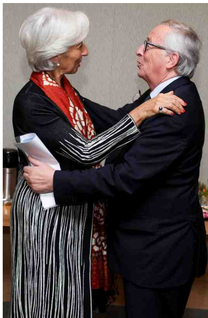
Met de benoeming van Christine Lagarde bij de Europese Centrale Bank haalde Macron een topfunctie binnen. Op de foto Lagarde met Juncker.

Von der Leyen heeft net als Macron aangegeven een begin te willen maken met een Europees leger