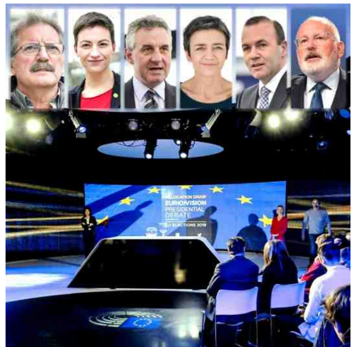
De Spitzenkandidaten van het Europees Parlement.