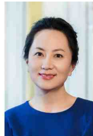
Meng Wanzhou is in december 2018 in Canada gearresteerd.

Over het algemeen wordt aangenomen dat de Chinese economie in 2030 die van de VS voorbij zal streven. Uiteraard moet dan de groei van de Chinese economie die jaarlijks tussen de 6 en 7 percent is, wel doorzetten tot 2030. De Chinese macro-economische cijfers zijn indrukwekkend. De reserves van het land bedragen 3000 miljard dollar (!) waarvan 1100 miljard aan Amerikaanse staatsobligaties. Het land exporteert jaarlijks voor 2900 miljard dollar en importeert voor 2200 miljard dollar. Met de VS is er een handelsoverschot van 323 miljard dollar. De Chinese politieke leiding, die nog steeds in een één partijensysteem denkt en handelt, heeft besloten om deze enorme economische macht om te zetten in politieke wereldmacht.