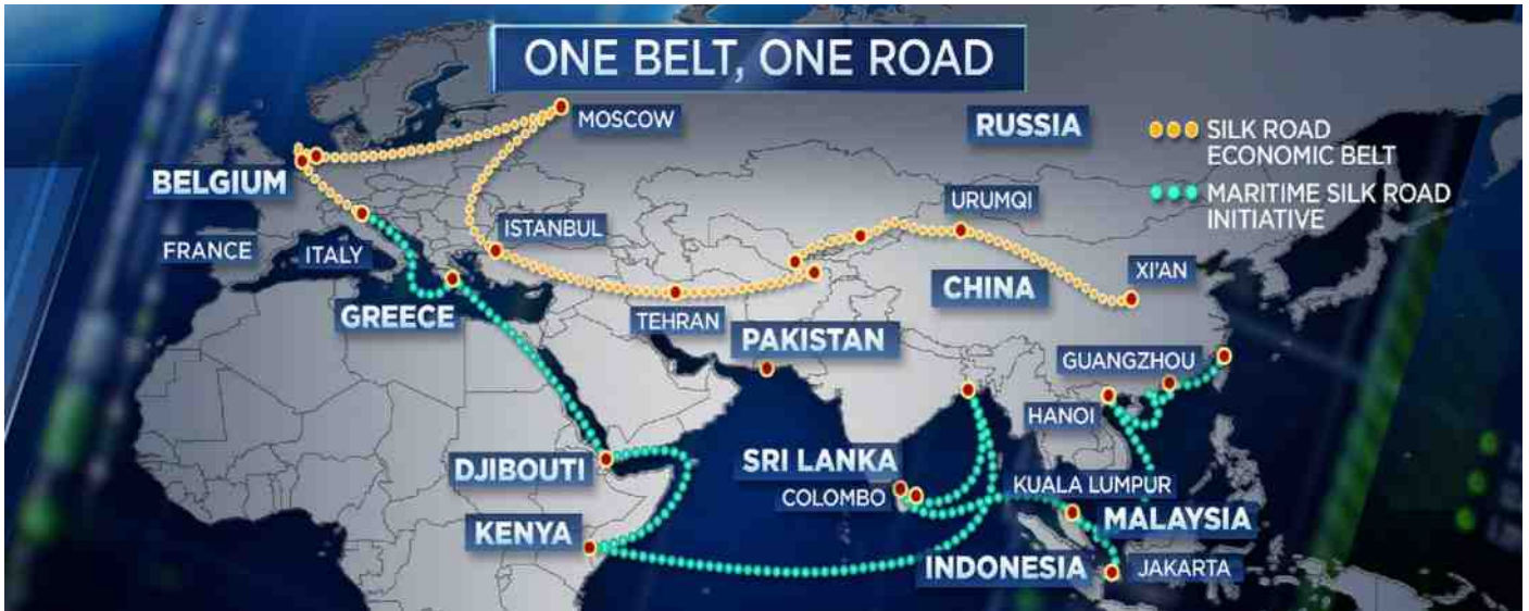
Met de aanleg van de 'Nieuwe Zijderoute', ook wel 'One Belt, One Road' (OBOR) genoemd, heeft China een wereldomvattend offensief concept.

De huidige Chinese president Xi Jinping die zijn volmachten heeft uitgebreid en langer president van China zal blijven, heeft in 2013 besloten dat China een wereldmacht zal worden toen hij de beslissing nam om de 'Nieuwe Zijderoute' te ontwikkelen. Met de aanleg van de 'Nieuwe Zijderoute', ook wel 'One Belt, One Road' (OBOR) genoemd, heeft China een wereldomvattend offensief concept waarmee het zich kan meten met Westerse globalisering. Het idee is om China via vooral snelle landconnecties met grote continentale blokken, zoals Rusland, de EU en India te verbinden. Met OBOR heeft China duidelijk aangegeven dat het geen onderdeel wil zijn van Westerse hegemonistische aanspraken, maar denkt in termen van een multipolaire wereldordening die naast de VS een tegenhanger heeft in Azië, namelijk China.