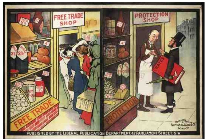
London School of Economics and Political Science 2007 Coll Misc 0519-32