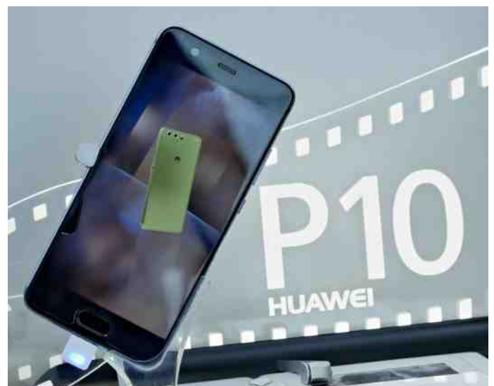
Het Westen heeft zich laten verrassen door de snelle opkomst van Huawei en andere Chinese hightechbedrijven.