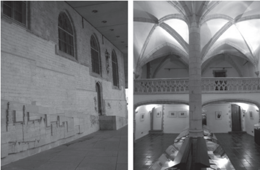
Buiten- en binnenzicht van de Sint-Joriskapel, enig overgebleven restant van het laatmiddeleeuwse hof van Nassau, nu onderdeel van de Koninklijke Bibliotheek van België te Brussel (© Bram Vannieuwenhuyze).

Enkel de Sint-Joriskapel overleefde het stedenbouwkundige geweld en werd in de nieuwe betonarchitectuur geïncorporeerd.