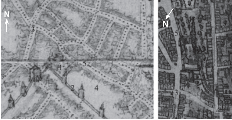
Fragmenten uit de stadsplannen van Jacob van Deventer (ca. 1554) en Braun & Hogenberg (gedrukt in 1572) met aanduiding van 1. het hof van Nassau; 2. de eerste stadsomwalling; 3. het kruispunt aan het Cantersteen; 4. de Jodenpoel (bij benadering); en 5. de Groenstraat (© Koninklijke Bibliotheek van België).

van Polanen of ‘naast het huis van de jonker van Nassau’ (71) . Aangezien al deze akten opgenomen zijn in het Nassause bronnenbestand, gaat het om eigendommen die later door de Nassau’s werden ingepalmd.