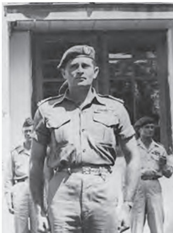
Raymond Westerling in 1948.

Zo is de filmster enerzijds buitengewoon en anderzijds heel gewoon. De ster is buitengewoon door het bezitten van een talent dat wij als publiek niet bezitten, maar moet tegelijkertijd gewoon genoeg zijn om herkenbaar te blijven voor het publiek. Ook zijn sterren aan de ene kant een product van de massacultuur terwijl ze aan de andere kant unieke kwaliteiten bezitten. Ze worden dus tot ster gemaakt, maar bezitten daarvoor al de unieke kwaliteiten om een ster te worden. Verder zijn ze een vertegenwoordiging van sociale, culturele en ideologische waarden terwijl ze ook persoonlijke individualiteit bezitten. Tot slot zit de laatste tegenstelling in de receptie van de filmsterren: veel sterren representeren dominante normen en waarden, maar tegelijkertijd kunnen ze door margi-