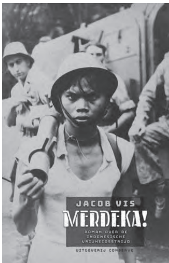
Omslag van Jacob Vis, Merdeka! (2016).

Ter zake. Wij van de MID zoeken een vent die de gangen kan nagaan van het depot speciale troepen, met name van hun commandant, een zekere kapitein