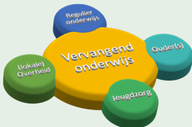
Figuur 2: Vervangend onderwijs in de context van het mbo en mogelijke betrokken partijen

Positionering van de vervangende programma's ten opzichte van het reguliere mbo-onderwijs heeft onder andere te maken met de doelstellingen en uitgangspunten van het initiatief. Vervangend onderwijs dat tot doel heeft dat de jongere weer terug gaat naar het mbo en een startkwalificatie haalt, werkt nauw samen met het reguliere onderwijs. Docenten van het mbo zijn bijvoorbeeld in nauw contact met het vervangende onderwijs en stimuleren mbo-studenten om een vervangend programma te gaan volgen, zij geven soms ook lessen, workshops of trainingen op de locatie van het vervangende programma. Soms worden de programma's ontwikkeld in samenwerking met mbo-scholen om als vangnet te dienen voor de jongeren van die instellingen. In de praktijk is er ook afstemming met de lokale overheid met name als de jongeren leerplichtig zijn. Omdat er vaak sprake is van meervoudige problematiek wordt er waar nodig samengewerkt met partners uit de gezondheids- en welzijnssectoren, lokale jeugdwerkers, de verslavingszorg, de GGZ schuldhulpverlening, vluchtelingenwerk, reclassering, maatschappelijk werk et cetera.