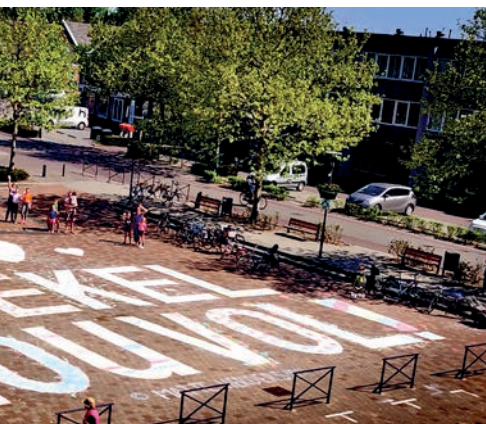
Kritische krijtteksten op het Malieveld, Den Haag

de verzameling. Het materiaal krijgt een Creative Commons-licentie. Van der Zande benadrukt dat het lastig is om te bepalen wat relevant is voor deze periode. Door zo breed mogelijk te collectioneren kan op een later moment eventueel worden gefilterd.