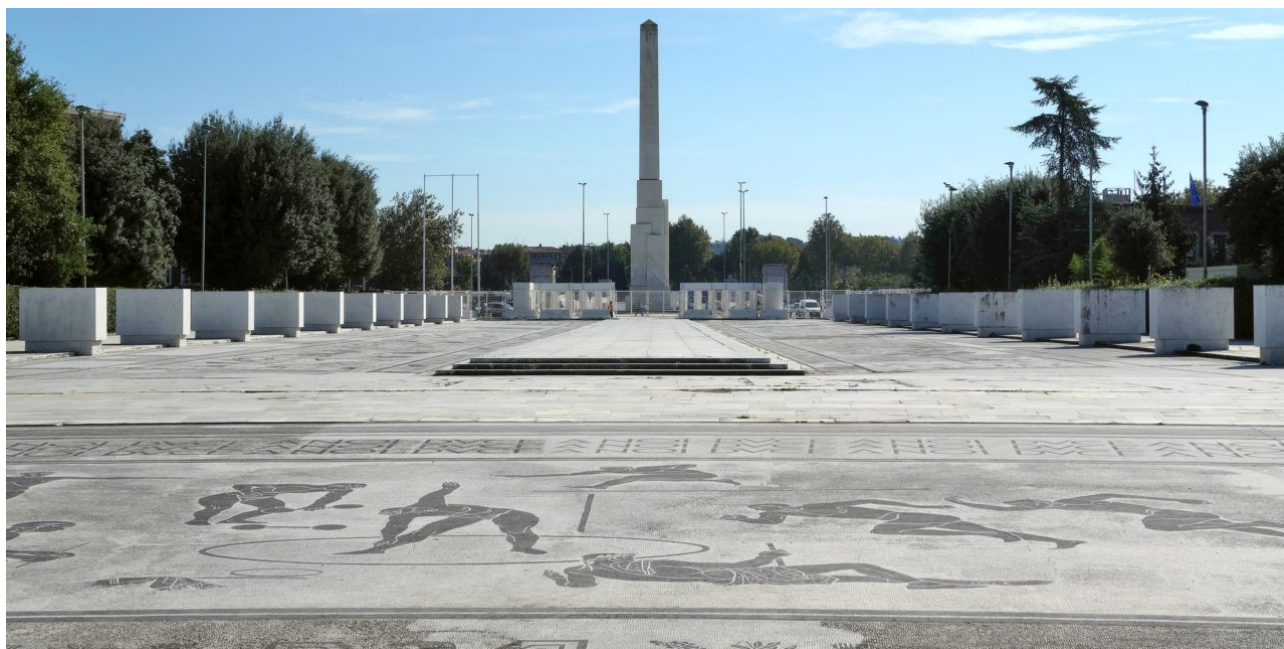
Il Foro italo.

Apr 2, 2020 | In evidenza , Pensare la didattica | 0