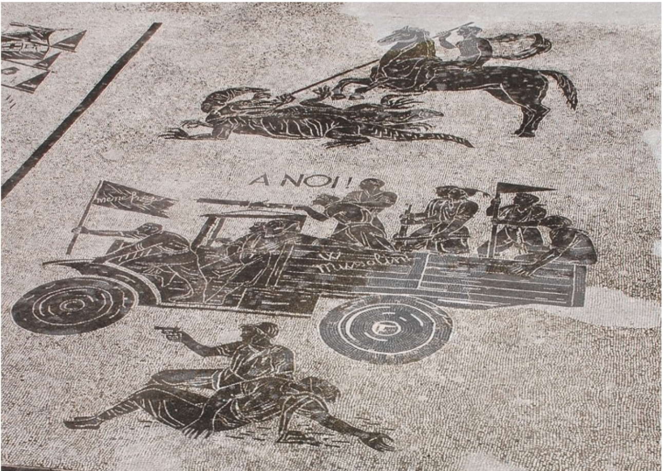
Figure 1: Dettaglio dei mosaici del Foro italico.