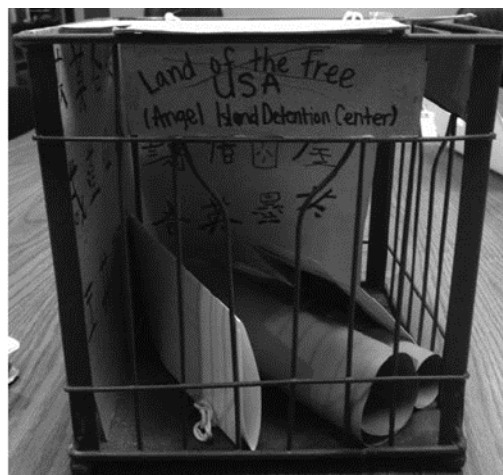
Figuur 1. Voorbeeld: Journey Box over Angel Island (Eric Ruiz Bybee, 2015).

voorbeeld van begeleid onderzoekend leren over geschiedenis. Het voorbeeld dat we daarna bij taalgericht vakonderwijs geven (voorbeeld 4), past ook bij de didactiek van begeleid onderzoekend leren.