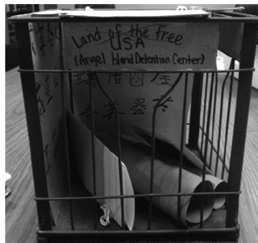
Figuur 1. Voorbeeld: Journey Box over Angel Island (Eric Ruiz Bybee, 2015).

voorbeeld van begeleid onderzoekend leren over geschiedenis. Het voorbeeld dat we daarna bij taalgericht vakonderwijs geven (voorbeeld 4), past ook bij de didactiek van begeleid onderzoekend leren.