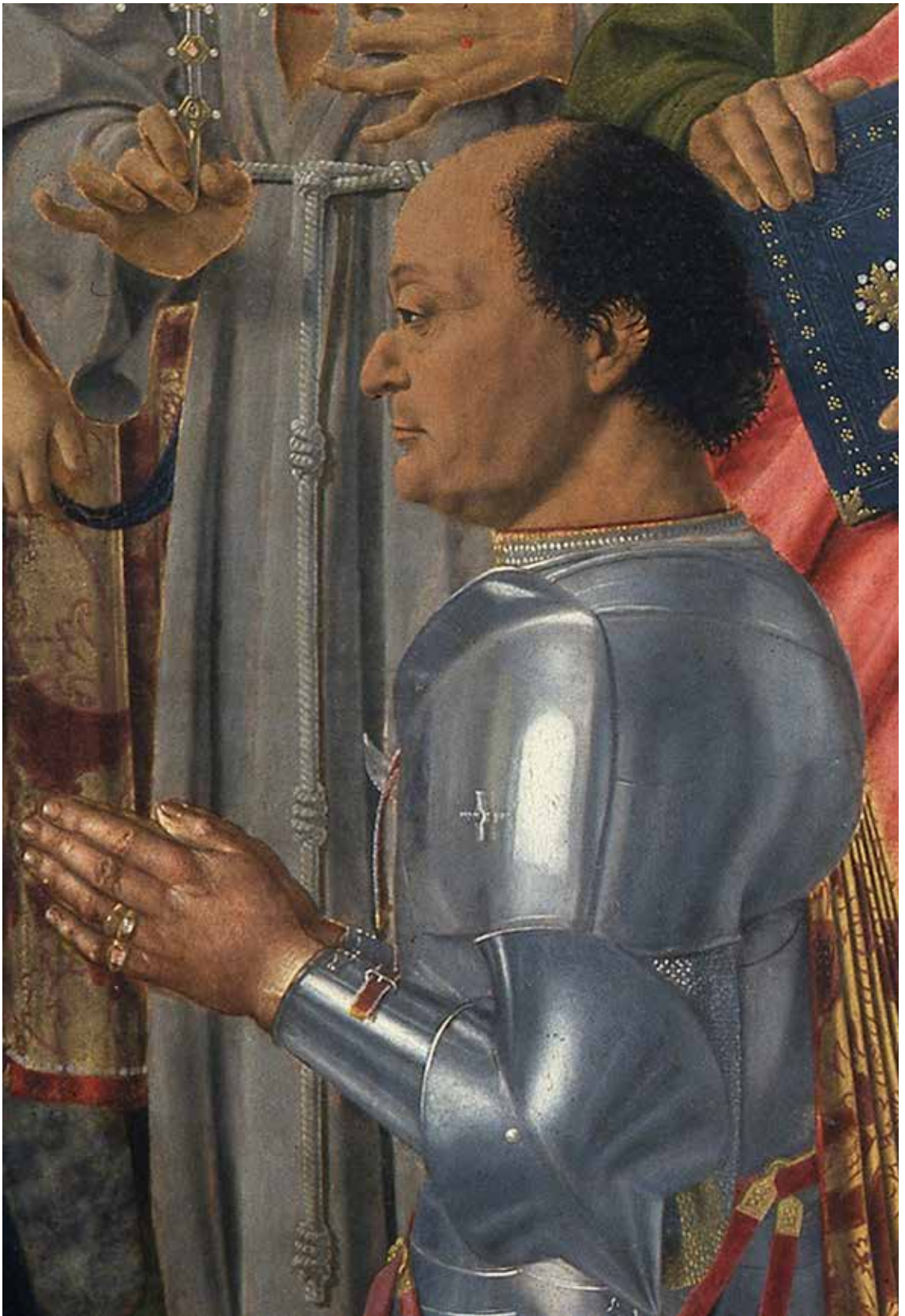
7. Riflesso di un'apertura centinata nell'armatura di Federico di Montefeltro nella Pala Montefeltro di Piero della Francesca (fig. 1).