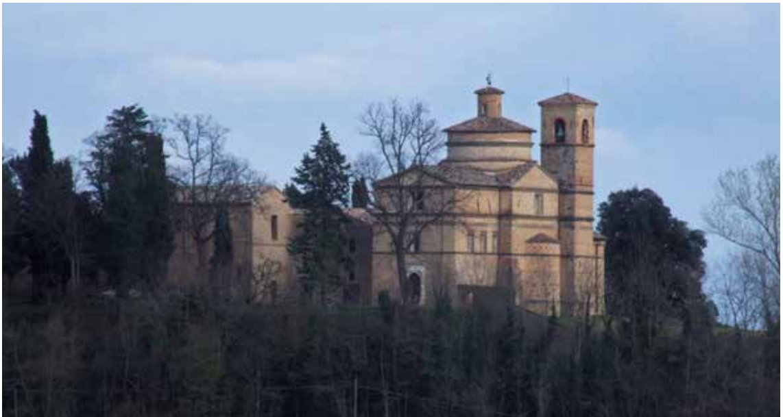
2. La chiesa conventuale di San Bernardino ad Urbino con a sinistra l'ex-chiesa di San Donato.

traspare dai documenti. Colmando alquanto la frammentarietà degli archivi conventuali e ducali, da un primo sopralluogo nel ben conservato archivio notarile urbinato risultano dei lasciti testamentari alla fabbrica della chiesa e del convento dei frati di San Donato 21 . Questi sono degli anni 1429, 1455, 1460, 1463, 1466 (due volte), 1469, 1471 (tre volte), 1475, 1476, 1477 e 1481 22 . Che i lavori stessero progredendo è indicato nel 3 maggio 1454, quando Jacopo figlio di Pero e di Gondola da Ragusa si confessa frate e perciò fa testamento, stipulando l'atto "in dicto loco Sancti Donati et in primo claustro dicti loci in quo est cisterna", frase che indica che erano già state edificate delle strutture conventuali compresi un primo e dunque anche un secondo chiostro 23 .