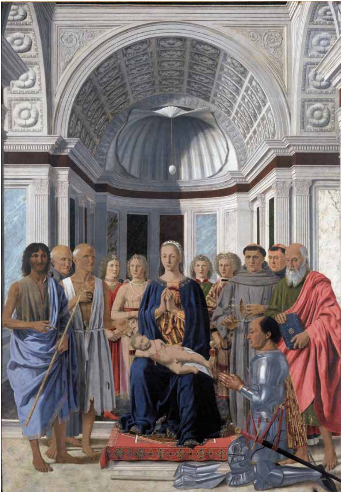
1. Piero della Francesca, Pala Montefeltro (1469-1472 ca), tempera e olio su tavola, 251 x 173 cm ca, Milano, Pinacoteca di Brera.