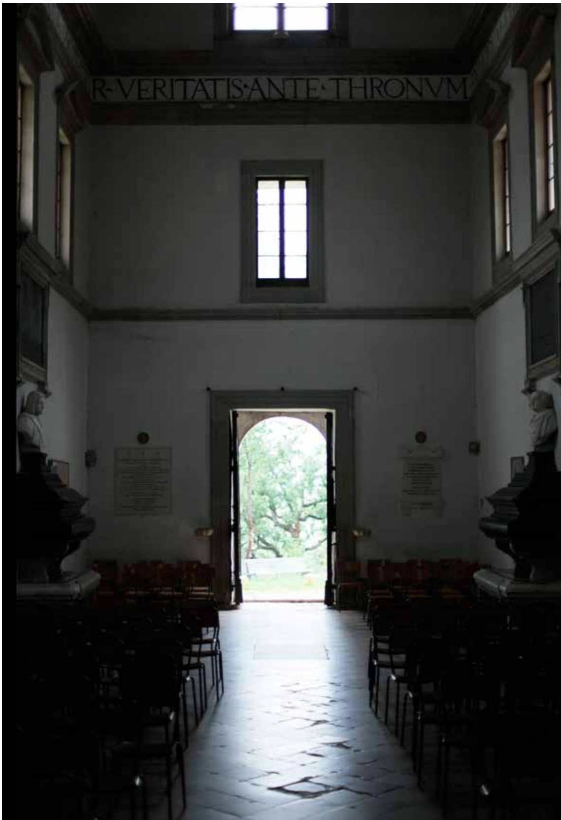
8. Vista della navata della chiesa di San Bernardino a Urbino con la porta aperta.