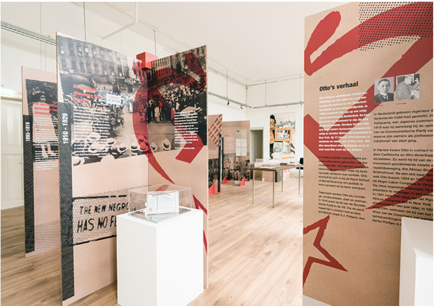
A Fekete és forradalmi című kiállítás.

A II. világháború idején a Huiswoud házaspárt mint nemkívánatos kommunista-szimpatizánsokat már figyelte az FBI és a holland hírszerzés (BVD), különösen azután, hogy Otto 1941-ben politikai okok miatt börtönbe került Suriname-ban, ahol a holland fasiszta párt (NSB) tagjaival, nácikkal, német zsidókkal és kommunista szimpatizánsokkal együtt raboskodott. Ezt a zavaros epizódot Raul Balai műve emeli ki a kiállításon a titkosszolgálatok jelentéseiből összeállított tapétával, amelyen további két suriname-i értelmiségi is látható. Hermina mindeközben folytatta tevékenységét New Yorkban, ahol előadásokat és eseményeket szervezett színesbőrű szocialista művészekkel, értelmiségiekkel és aktivistákkal együtt.