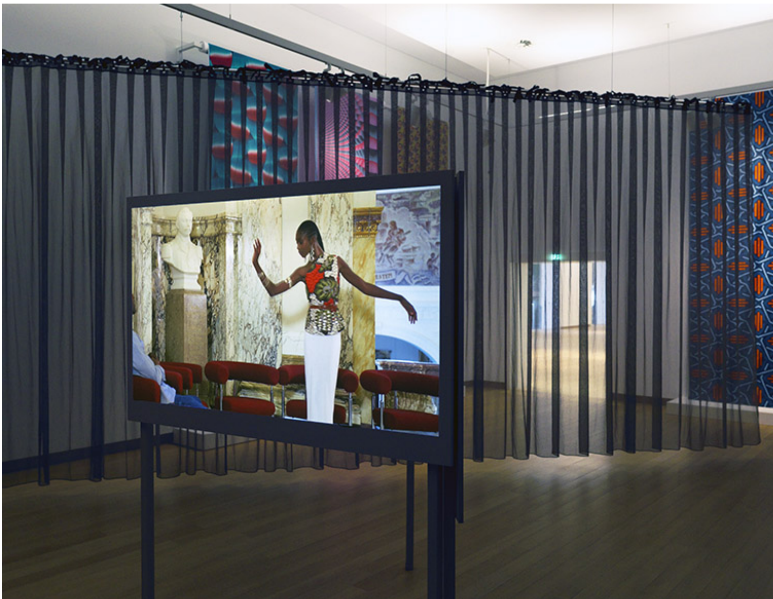
Z "I Am a Native Foreigner" című kiállítás, Stedelijk Múzeum, Amsterdam

A legtöbb holland múzeumi gyűjteményre jellemző „fehér felsőbbrendűség” szemléletének aláásása végett az eindhoveni Van Abbemuseum több olyan, az intézmény koloniális múltjára és jelenlegi társadalmi hasznosságára reflektáló projektet szervez, amelyek a művészeti intézmények dekolonizálását sürgetik. A kutatásalapú, hosszútávú projektek elsősorban a múzeum kollekciónak és archívumának önreflexív újraértelmezésére koncentrálnak és számos külső kutató bevonásával valósulnak meg, például: The Making of Modern Art, Demodernising the Collection, Deviant Practice.