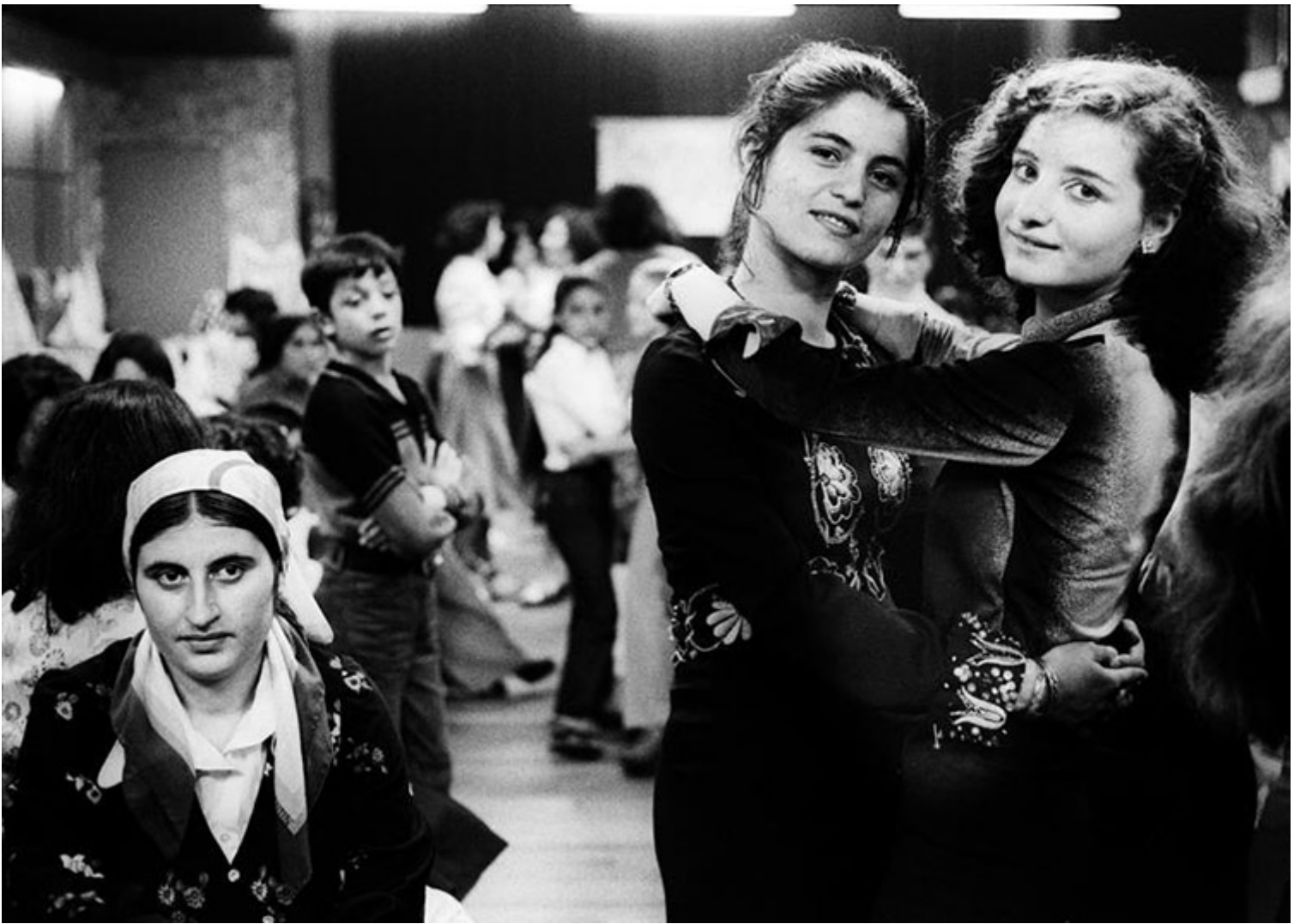
Bertien van Manen: Turkish girls at a party in Schiedam, 1977, Stedelijk Múzeum

A Stedelijk Múzeum "I Am a Native Foreigner" című kiállítása jó példa erre, amely a migráció különböző aspektusait járja körül a múzeum kollekción keresztül. A társadalmi problémák és a diszlokáció nehézségeinek láthatóvá tétele legitim célkitűzés, az intézmény azonban nem az érintetteknek ad hangot a számukra releváns kérdéseket feltéve vagy alternatív megoldási lehetőségeket felmutatva, hanem elsősorban saját gyűjteménye, azaz önmaga reprezentációjára fókuszál bármiféle önreflexió nélkül.