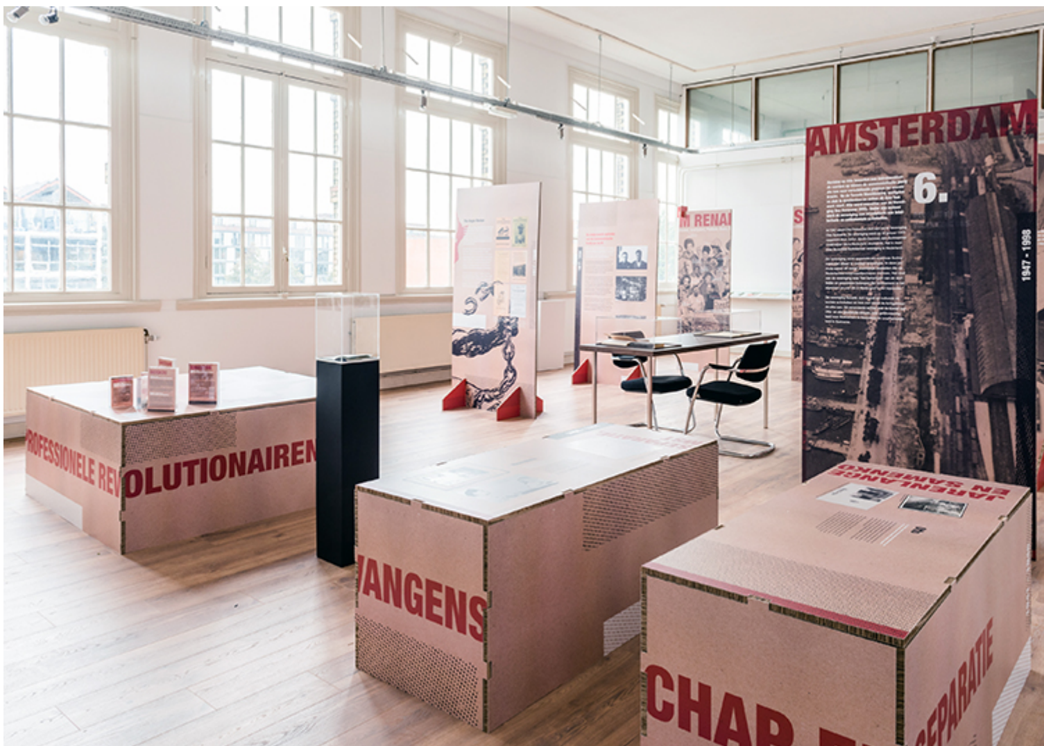
A Fekete és forradalmi című kiállítás.

A holland nemzeti kánon reprezentációjának első számú intézményében, a Rijksmuseum-ban évszázados hajómodelleken, díszes fegyvereken és diadalmas felfedezőutak emlékét őrző festményeken keresztül diákok és turisták ezrei ismerkedhetnek meg a „holland aranykor” történetével – a gyarmatosító hatalom szemszögéből. Ez a narratíva azonban nem ábrázolja a gyarmatosítás sötét oldalát, a virágzó gazdasági és kulturális élet anyagi felételeit megteremtő körülményeket, ami a leigázott népek kizsákmányolásán és a rabszolgaság intézményén alapul. Nem ad teret olyan, a gyarmatosítás következményeként kialakult társadalmi csoportok perspektíváinak, mint például a suriname-i származású hollandoké, akik ősei a holland rabszolgakereskedelem miatt nagyrészt Afrikából kerültek a Brazíliával szomszédos Suriname-ba, majd jelentős részük az 1970-es években Hollandiába települt.