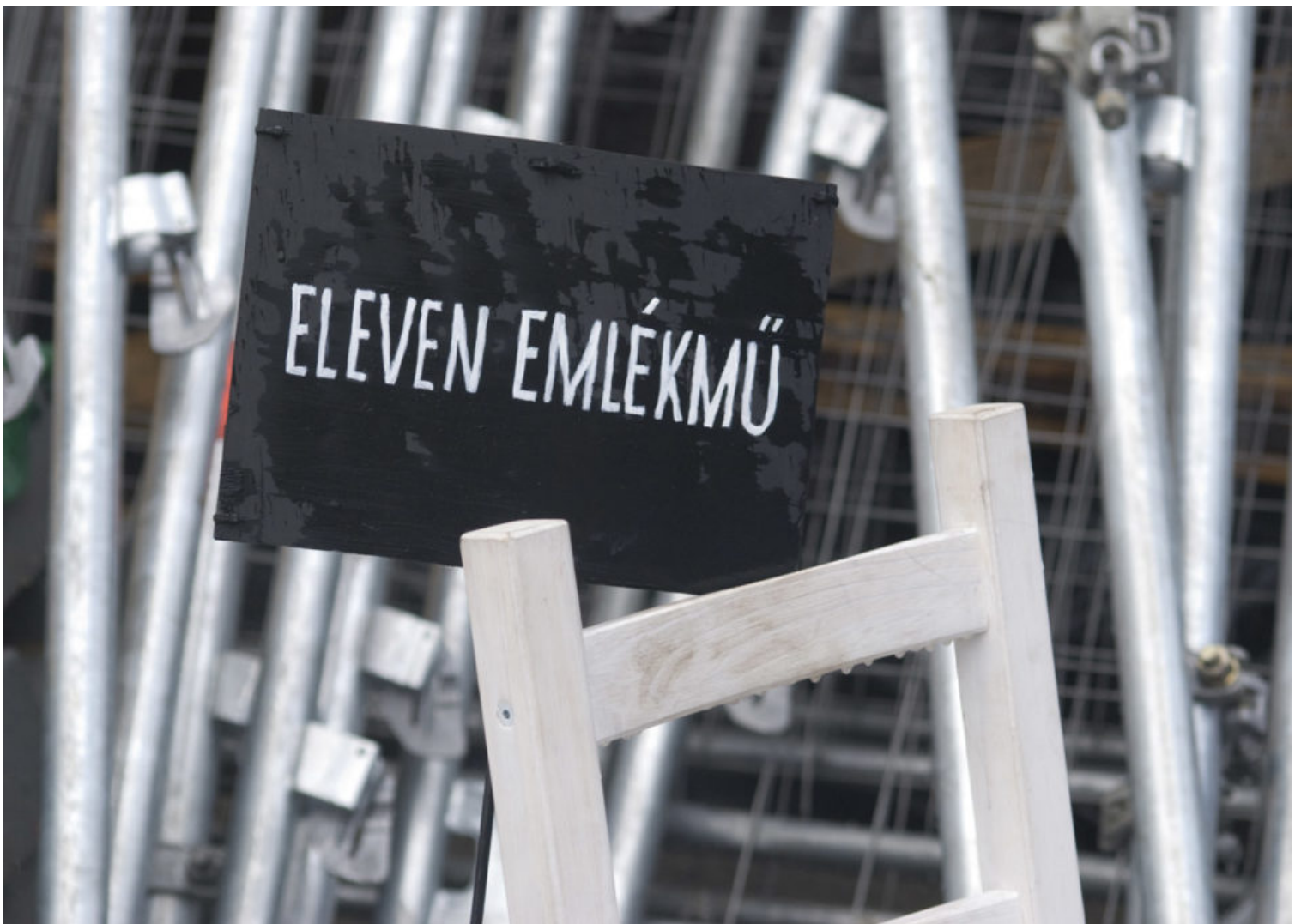
Eleven Emlékmű - fotóösszé, részlet, 2014. FreeDoc - Csozó Gabriella. Forrás: http://www.litera.hu/netnaplo/csozo-gabriella-fotonaploja .

A történeti narratívák és a politikai érdekek szoros összefonódását a magyar kormányzat emlékezetpolitikája is egyértelművé tette. A kirekesztő és egyoldalú narratívát megtestesítő Német megszállási emlékmű (2014), amely a kormányzat önkényes döntését képviseli a kollektív emlékezet kérdéseit illetően, egyedi ellenállási stratégiát idézett elő a vitatott történelemszemlélet megkérdőjelezésére. Az Eleven Emlékmű (2014-) a hivatalos narratíva hiányosságaira reflektálva olyan ellen-narratívákat fogalmaz meg, amelyek segítségével át is írja a nem kívánt emlékmű jelentéseit. Így az alulról építkező „ellenemlékmű” egyrészt lehetővé teszi az alternatív, személyes emlékezet többretegű megnyilvánulását, másrészt a folyamatos reflexió platformjává teszi a Német megszállási emlékművet .