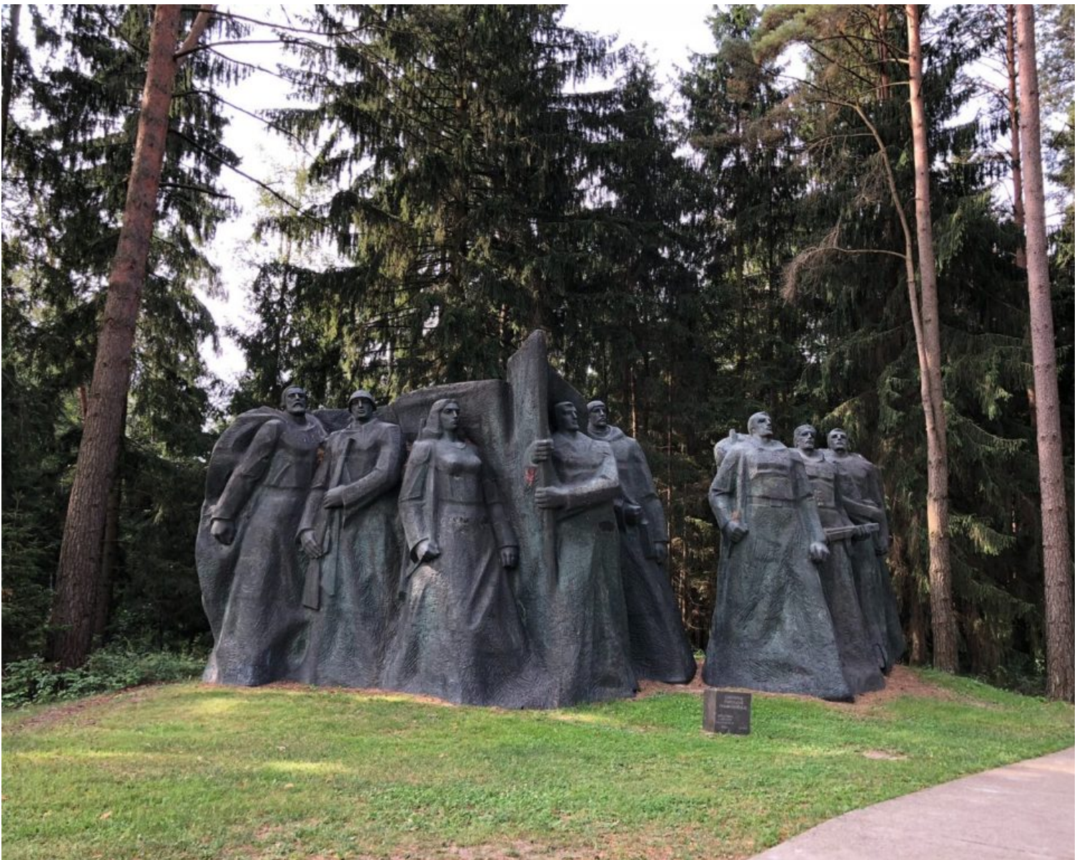
Grutas Park, Litvánia.