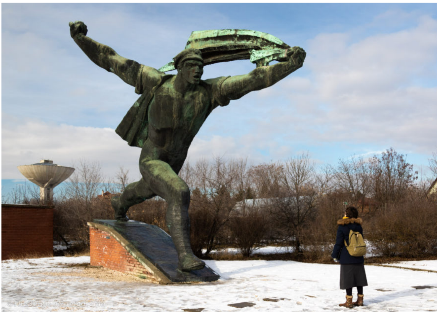
Látogató a Szoborparkban, Budapesten.

Mit lehet kezdeni a problémássá váló emlékművekkel? Milyen módszerek léteznek azok megőrzésére úgy, hogy többé ne sértsék egyes csoportok önazonosságát és értékrendjét? A poszt-socialista országok történelme számtalan kísérletet vonultatott fel az elavult emlékművek problémájának megoldására az elmúlt évtizedek során, hiszen az értelmezési keretek radikális átalakulása 1989 után az emlékművek megőrzésének és áthelyezésének különféle stratégiáit eredményezte. Bár ezeket nagy mértékben meghatározza a történelmi narratívák beágyazottsága a helyi társadalmi-politikai viszonyokba, mégis érdemes végiggondolni néhány példán keresztül az emlékművek megőrzésének módjait, hiszen e kérdés újra sürgetővé vált a rasszizmus és a gyarmatosítás örökségének újraértékelése kapcsán.