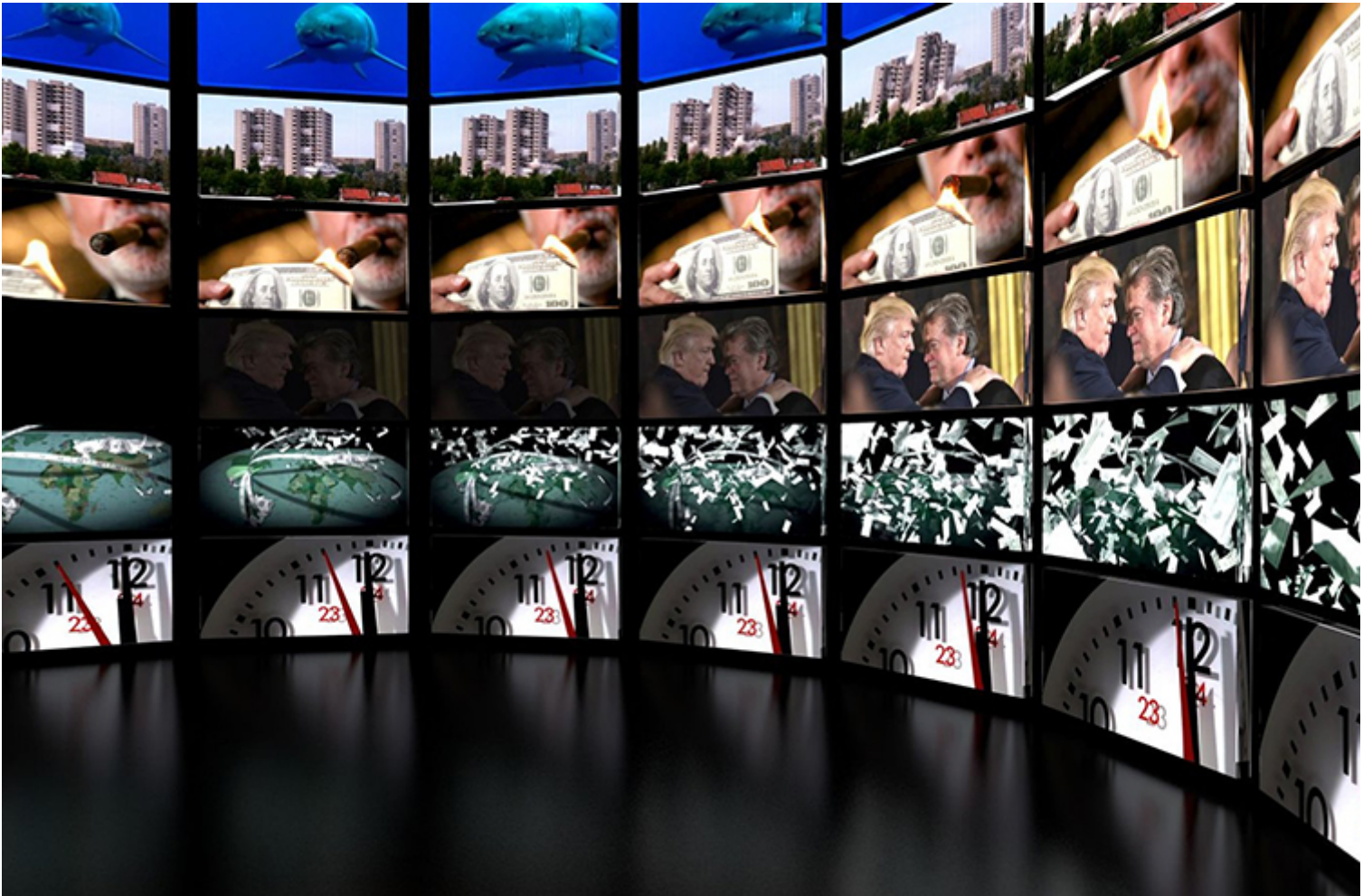
Kiállásenteriór a Het Nieuwe Instituutban, Rotterdamban.

működik szorosan együtt. Staal legújabb kiállítása a propaganda mechanizmusát vizsgálja a Fehér Ház egykori vezető stratégiájának dokumentumfilmjein és projektjein keresztül, és a vizuális eszközök értelmezése mellett arra a kérdésre keresi a választ, hogy miként lehet ellen-narratívákat, azaz egyfajta „emancipációs propagandaművészetet” kialakítani a jobboldali populizmussal szemben.