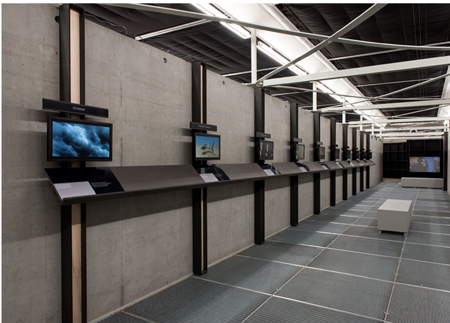
Kiállásenteriór a Het Nieuwe Instituutban, Rotterdamban.

Kevesen tudják, hogy Bannon jelentős dokumentumfilmes karriert is maga mögött tudhat. A 2001. szeptember 11-i terrortámadás hatására politikai nézetei radikalizálódtak, ami filmjeiben egyértelműen kifejezésre jut. Saját stílusát „kinetikus moziként” határozza meg, és elsődleges célja a film fegyverré tétele az ideológiai harcban. Legfőbb inspirációs forrásként Michael Moore, Szergej Eisenstein és Leni Riefenstahl filmjeire tekint, mert munkásságukban a politikai tartalmak mellett a közlés módja alapvető fontosságú. 2004-2016 között készült kilenc dokumentumfilmje látszólag valós eseményeken, adatokon és szakértői elemzéseken alapszik, de az apokaliptikus hangulatú, gyors zenével kísért, vadul váltakozó képsorok a néző félelemérzetének felébresztését célozzák a kívánt ideológiai tartalmak kommunikálása érdekében. Az In the Face of Evil (2004) például a Bannon által ideális, erős vezetőnek tartott Ronald Reagan kommunizmus elleni küzdelmét állítja párhuzamba a nyugati keresztény szabadpiaci nacionalizmus és a keleti iszlám terrorizmus harcával, ami igencsak leegyszerűsítő és problematikus történelemértelmezés.