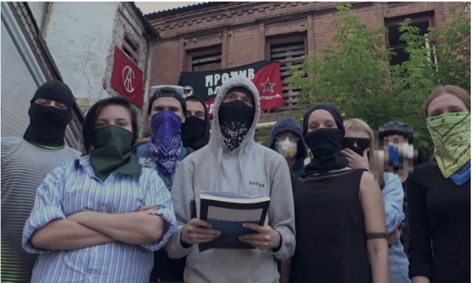
Mykola Ridnyi Grey horses (2016)

A közelmúlt tüntetéseivel és a közvetlen politikai ellenállással több munka foglalkozik. Gluklya a Clothes for Demonstrations Against False Election of Vladimir Putin (2011-2015, 2016) sorozatokból származó vízfestményei és szénrajzai a 2011-2013 közötti Putin-ellenes tüntetésekre reagálnak. Nikita Kadan Limits of Responsibility (2014) című installációja a kijevi tüntetések során a Függetlenség terén létrehozott ideiglenes kertet emeli be a galéria terébe és kombinálja egy 1979-es szovjet mezőgazdasági kézikönyv ábrája alapján épített, üresen hagyott kiállítási paravánnal. A 2015-ös örmény tüntetések is előkerülnek Tigran Khachatryan Like it or Not: The Armenian Communist Party Should Be Given to This Young People című videóján (2016), amelyet a civil aktivizmus folytatásának szán.