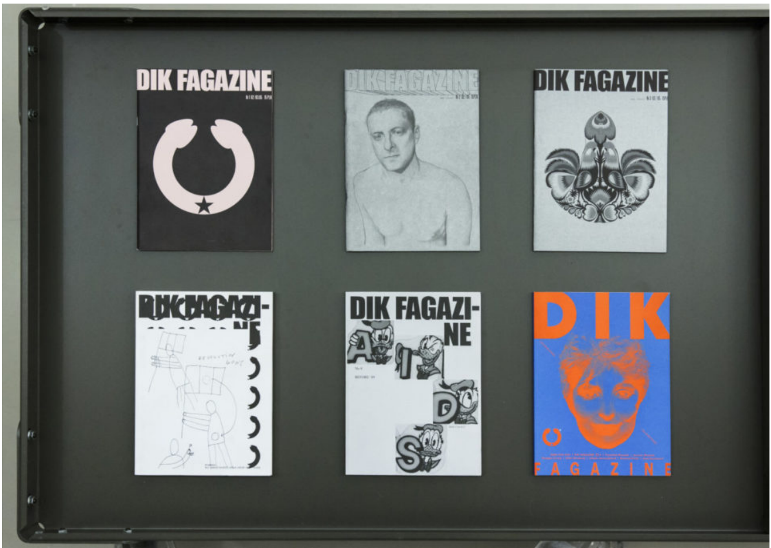
Karol Radziszewski : QAI/Revolution (2017), detail.

Két olyan munka látható a kiállításon, amely archívumokat használ fel és értelmez újra. Bár tematikailag eltérő a két projekt, mindkettő rávilágít a megőrzött dokumentumok jelentőségére a múlt és a jelen megértéséhez. Karol Radziszewski installációjában a Queer Archives Institute anyagából szelektál ( QAI/Revolution , 2017). A művész által kezdeményezett archívum a középkelet európai queer mozgalmakra fókuszál. A válogatás bemutatja például a régió egyik első gayzine-jét és a hozzá kötődő, nyolcvanas években készült privát fotókat, amelyek bepillantást engednek a lengyel homoszexuális közösségek életébe és az „AIDS-korszak” kelet-európai vonatkozásaiiba.