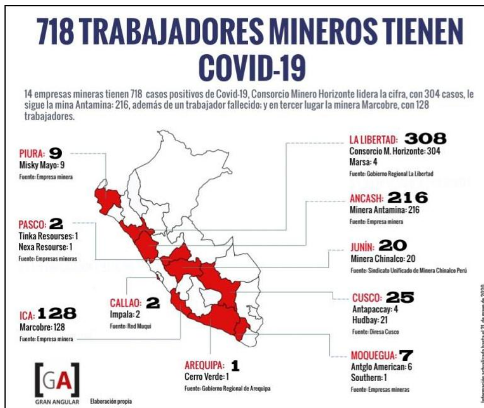
Figura 2: Número de trabajadores mineros infectados con Covid-19 en Perú, por compañía y región.

medida. Aunque los dirigentes sindicales locales se pronunciaron sobre la falta de medidas de protección, sus protestas no pudieron evitar que el virus se propagara rápidamente entre los trabajadores de las minas. El primer caso de Covid-19 se registró el 25 de marzo, y actualmente hay más de 700 casos de trabajadores mineros con el virus en todo el país (véase la figura 2). Este alarmante número de infecciones entre los trabajadores de las minas da fe de la insuficiencia de las medidas que se tomaron y de los riesgos que tomaron las empresas mineras: sólo cuando sus trabajadores dieron positivo decidieron cerrar. También muestra el peso global que el Gobierno da al sector minero, de gran importancia económica, y su reticencia a adoptar medidas preventivas.