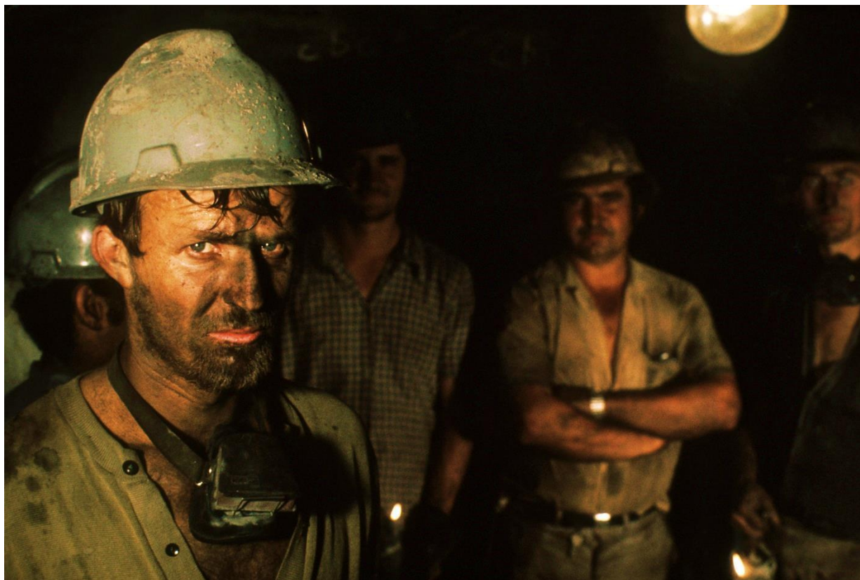
"Mineros en Brasil"