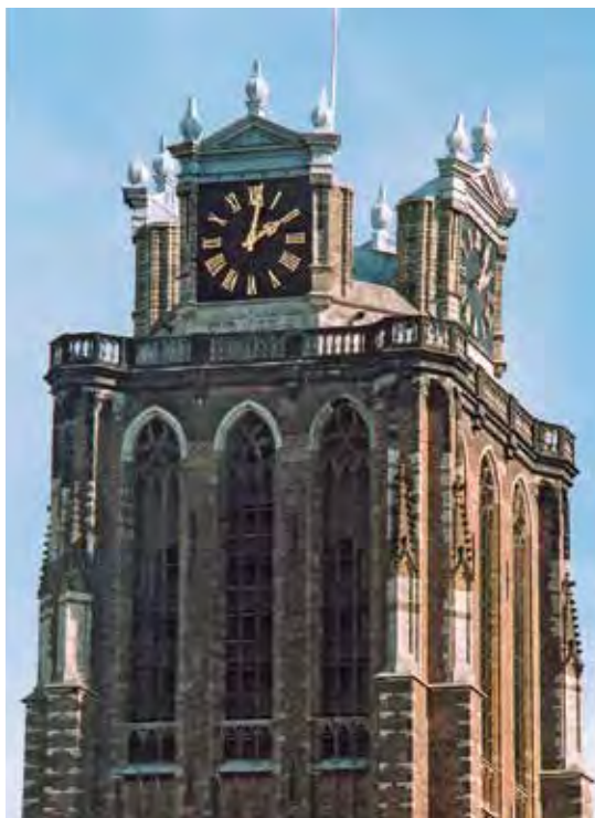
Dordrecht, Grote Kerk.

aanzien en zouden in 1669 ook bij de onvoltooide torenstomp van Wijk bij Duurstede terugkeren. Daar werden de wijzerplaten overigens, anders dan in Delft, in 1760 alsnog in een soort klokkenhuizen geplaatst, net als al in 1626 - het meest monumentale voorbeeld - bij de toren van de Grote Kerk van Dordrecht. Omdat zowel in Wijk bij Duurstede als Dordrecht de spits ontbreekt, en de klokkenhuizen dus de torenromp afsluiten, zijn zij daar tevens bepalend voor het silhouet. Nog weer een halve eeuw eerder, in 1570, werden in Delft zulke grote uurwijzers al in aparte, met driehoekige geveltjes getooide dakkapellen tegen alle vier zijden van het tentdak van de stadhuistoren aangebracht. Deze toren bleef bij de brand van 1618 gespaard en werd daarna opgenomen in de nieuwbouw van de Amsterdamse stadssteenhouwer Hendrik de Keyser (1565-1621). Zonder die driehoekige geveltjes zouden zulke dakkapellen voor de wijzerplaten nadien nog viervoudig terugkeren aan de voet van het soortgelijke vierkante tentdak dat, samen met de stenen vierkante klokkenverdieping eronder, in 1648-'50 op de toren van de Bartholomeuskerk in Schoonhoven was neergezet.