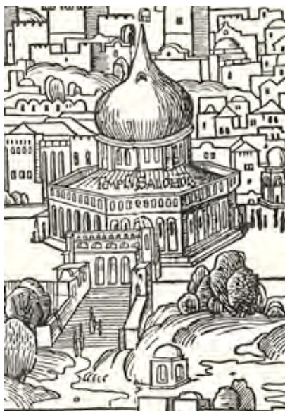
Panorama van Jeruzalem met de als Tempel van Salomo geïdentificeerde Rotskoepel, houtsnede van Erhard Reuwich uit de Peregrinatio in Terram Sanctam (1486) van Bernhard von Breydenbach.

gelegen - Rotskoepel (688-691) met de goddelijke Tempel van Salomo vereenzelvigd. Tevens kon voor dergelijke bekroningen de Heilig Grafkerk een belangrijke inspiratiebron vormen, die bij de herbouw in 1140-'49 door de kruisvaarders met een basilicaal schip en kloeke klokkentoren was vergroot. De begrijpelijke interesse voor dit oermonument van het christendom zou juist in de nadagen van de middeleeuwen binnen de 'reële' architectuur nog resulteren in een aantal verkleinde kopieën van de aparte Heilig Graedricula met zijn koe-