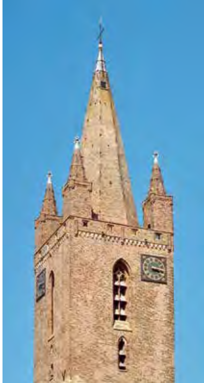
Kapelle, Hervormde Kerk.

Een derde nog binnen de huidige Nederlandse staatsgrenzen bewaard gebleven voorbeeld van zo'n torennaaldenkintet levert het Belfort van het stadhuis van Sluis in Zeeuws-Vlaanderen