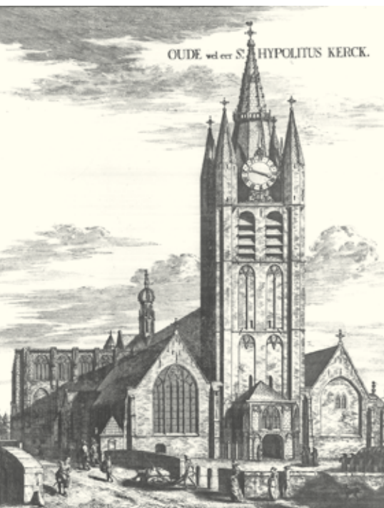
Delft, Oude Kerk, gravure van Coenraet Decker uit 1667.