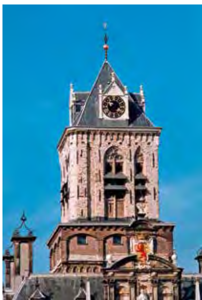
Delft, toren van het Stadhuis.