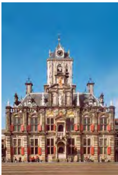
Delft, voorgevel van het Stadhuis.

Samen met het tot de late dertiende eeuw teruggaande, maar in de vijftiende eeuw met een lantaarn verhoogde en zijn karakteristieke tentdak bekroonde belfort van het stadhuis aan de Markt domineerden de torens van de Oude Kerk en de Nieuwe Kerk eeuwenlang de Delftse binnenstad. Opvallend: voor de bekroningen van beide kerktorens vormde Vlaanderen een belangrijke bron.