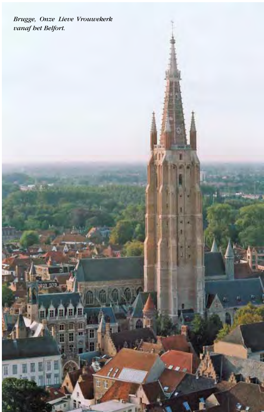
Brugge, Onze Lieve Vrouwekerk vanaf het Belfort.