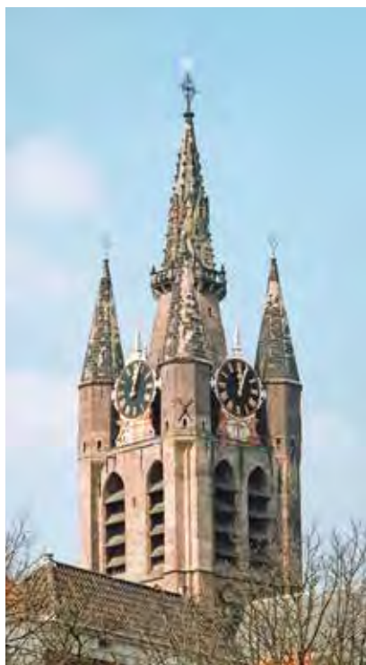
Delft, toren van de Oude Kerk.