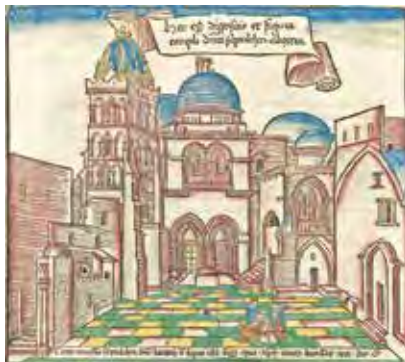
Heilig Grafkerk in Jeruzalem, houtsnede van Erhard Reuwich uit de Peregrinatio in Terram Sanctam (1486) van Bernhard von Breydenbach.

Met de door zulke ontdekkingsreizigers verkregen informatie verwierf men in de Nederlanden een veel natuurgetrouwer beeld van de architectuur ter plaatse dan men voorheen bezeten had. Sindsdien duikt bij de visuele verbeelding van Jeruzalem de Tempel herhaaldelijk in de verbasterde gedaante van de Rotskoepel op. Maar al veel eerder zou het Heilige Land door (uivormige) 'Tempel'-koepels of bolvormige torenhelmen worden gekarakteriseerd, die dan ook soms zeer concreet de Tempel of de Heilig Grafkerk moesten verbeelden. Van moskeeën of minaretten afgekeken, moesten zij al gedurende de hele vijftiende eeuw met name in de Vlaamse schilderkunst dienen om aan bijbelse voorstellingen een oriëntaals-exotische 'couleur locale' van het Heilige Land te verlenen. Bij 'Europese' taferelen uit deze tijd was daarentegen in de geschilderde architectonische stoffering geen spoor van zulke