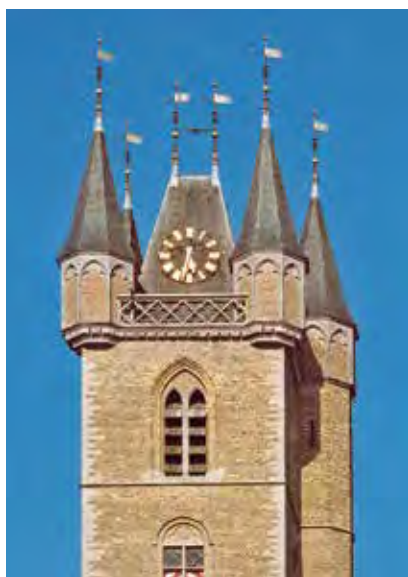
Sluis, belfort van het Stadhuis.