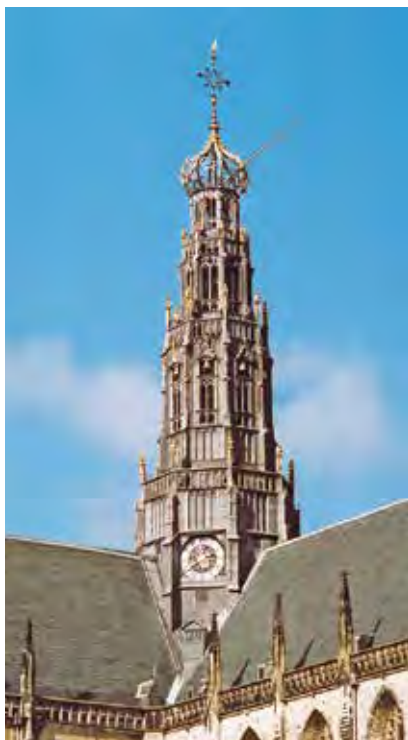
Haarlem, vieringstoren van de Bavo.