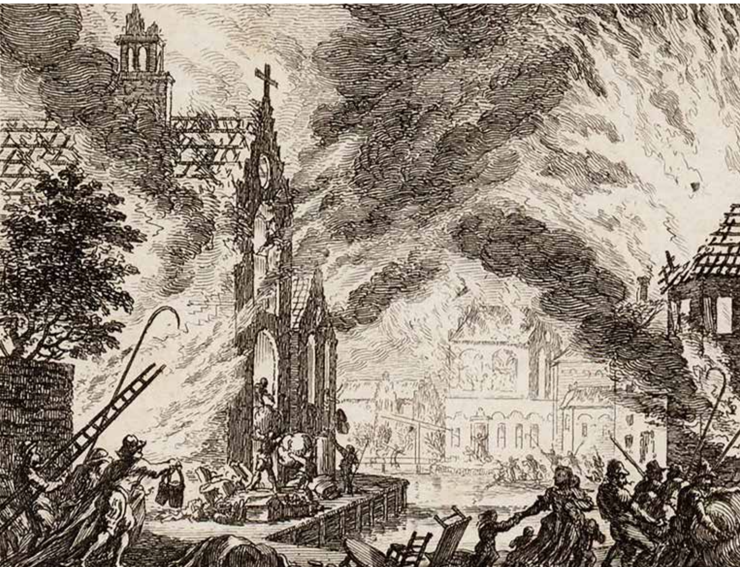
▲ Grote branden als die van 1421 en 1452 leefden voort in het geheugen van de stad. Tekening van die laatste uit 1782 door Fokke Simonsz.

Elisabethgasthuis met het aanpalende stadhuis aan de Dam en ook de Nieuwe Kerk, die op dat moment nog in aanbouw was en verre van voltooid. De huizen op de Damsluis lijken te zijn verbrand.