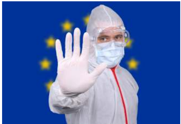
Europa neemt niet actief deel aan de wedren naar een coronavaccin.

Naar aanleiding van de jihadistische aanslagen in Nice en Parijs, waarbij daders van buiten de EU betrokken waren, heeft de Franse president Emmanuel Macron verklaard dat hij het Schengenverdrag, dat vrij verkeer van personen en goederen in grote delen van de EU garandeert, wil herzien en de buitengrenzen wil versterken. Volgens hem moet er een nieuw evenwicht komen tussen veiligheid en het vrije verkeer van personen en goederen. Het is de retoriek die we al veel te lang horen van Europese leiders als terroristen weer eens vernietigend hebben toegeslagen. Het onvermogen van de EU om de buitengrenzen te beschermen en de bereidheid om daarvoor nu zelfs een van de kroonjuwelen van de EU, namelijk het Schengenverdrag, dat een symbool van Europese eenwording en economische vooruitgang is, te willen offeren, toont weer eens aan dat de EU zonder effectieve veiligheidsinspanningen zich niet kan handhaven in de globale wedren.