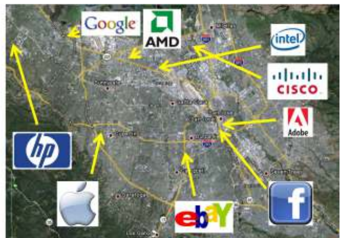
Een overzicht van techbedrijven in Silicon Valley. De VS beschikt over zeer grote en invloedrijke Big Tech bedrijven.

De uitweg uit de COVID-19 pandemie wordt door de WHO en de lidstaten van de WHO gezocht in het massaal vaccineren van de wereldbevolking. Vandaar dat de uitbraak van het coronavirus wordt begeleid door de jacht op een werkend vaccin. De grote mondiale machtsblokken zijn bezig met de ontwikkeling hiervan. Ook Rusland heeft zich in deze strijd gemengd en heeft in september al het vaccin Spoutnik-V op de markt gebracht. Het Chinese bedrijf Sinovac beweert dat het eind 2020 kan beginnen met vaccineren met behulp van een anti-coronavirus vaccin dat in China wordt geproduceerd. De Westerse vaccins zullen voornamelijk door Amerikaanse bedrijven, zoals Pfizer, Moderna, en Johnson & Johnson worden geproduceerd. De Europese bijdrage aan deze vaccijnacht is bescheiden en heeft vooral de vorm van licentiehouders van Amerikaanse bedrijven. Ook de kennis en de marktsector hieraan verbonden, lijken de EU voorbij te gaan. De Europese Commissie