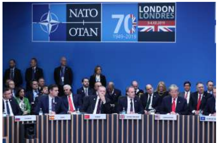
De Amerikaanse president Donald Trump heeft erop gewezen dat de Europese leden van de NAVO veel te weinig bijdragen.