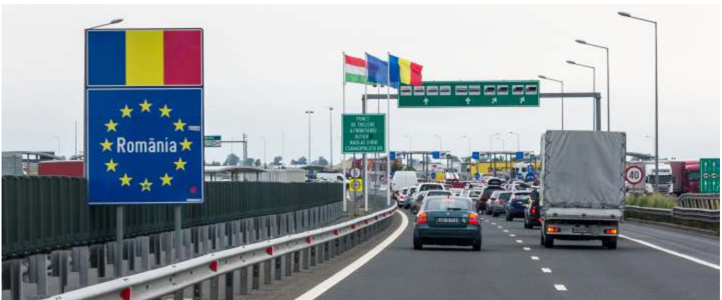
Macron wil het Schengenverdrag herzien en de buitengrenzen van de EU versterken.