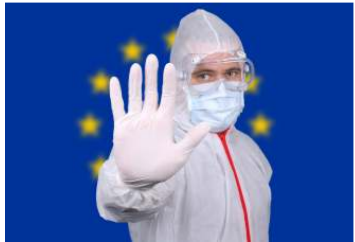
Europa neemt niet actief deel aan de wedren naar een coronavaccin.

Naar aanleiding van de jihadistische aanslagen in Nice en Parijs, waarbij daders van buiten de EU betrokken waren, heeft de Franse president Emmanuel Macron verklaard dat hij het Schengenverdrag, dat vrij verkeer van personen en goederen in grote delen van de EU garandeert, wil herzien en de buitengrenzen wil versterken. Volgens hem moet er een nieuw evenwicht komen tussen veiligheid en het vrije verkeer van personen en goederen. Het is de retoriek die we al veel te lang horen van Europese leiders als terroristen weer eens vernietigend hebben toegeslagen. Het onvermogen van de EU om de buitengrenzen te beschermen en de bereidheid om daarvoor nu zelfs een van de kroonjuwelen van de EU, namelijk het Schengenverdrag, dat een symbool van Europese eenwording en economische vooruitgang is, te willen offeren, toont weer eens aan dat de EU zonder effectieve veiligheidsinspanningen zich niet kan handhaven in de globale wedren.