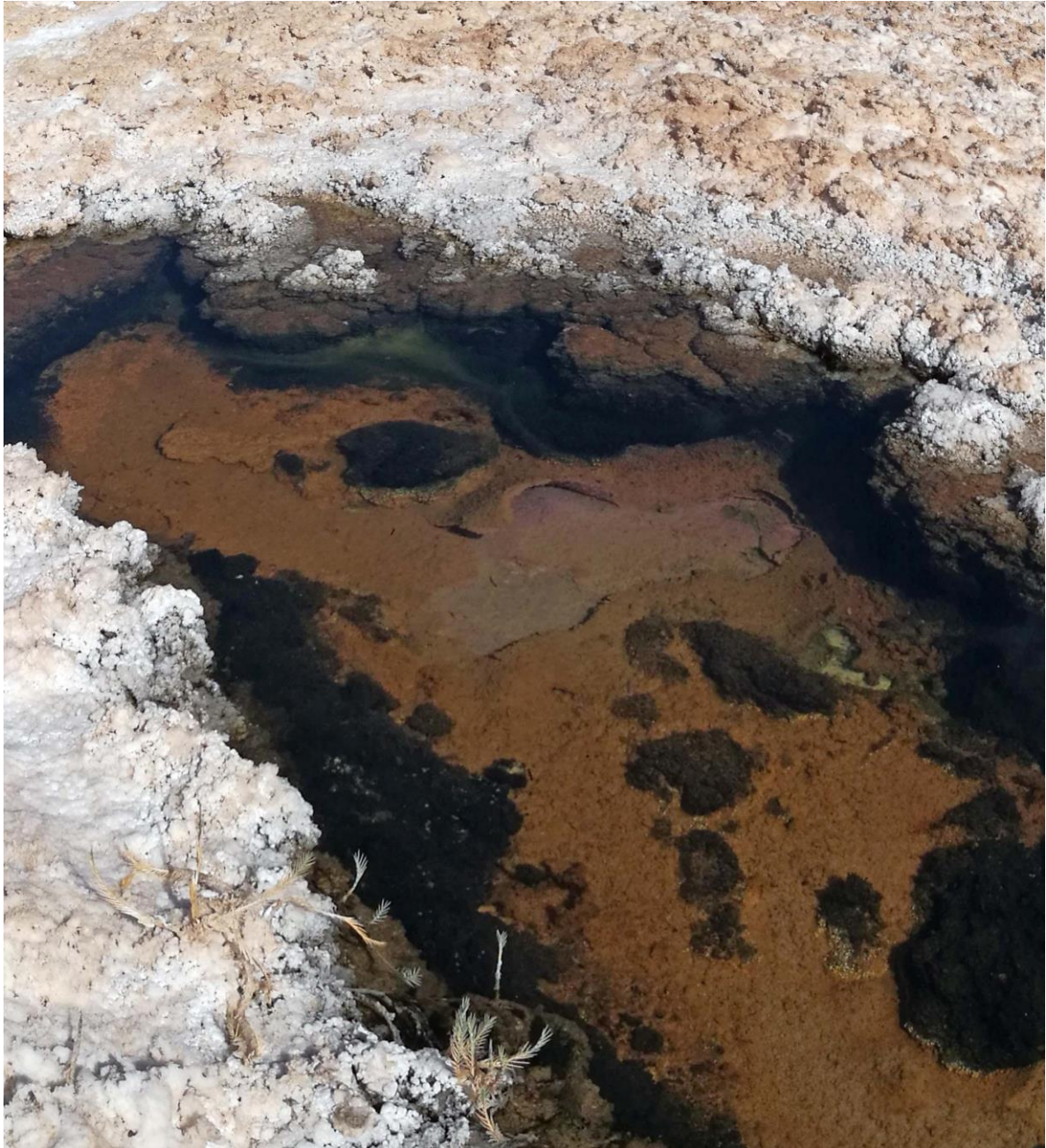
(Figura 9). Tapete microbiano flotando en las aguas del salar.

Este hecho alarmó aún más a un equipo de microbiólogos ya evidentemente sobrepasados con la situación. Para los ojos entrenados en microbiología de salares, el pedazo de tapete desprendido era la expresión de la muerte de una comunidad única de microorganismos, muerte que había sido producida por la inyección de agua dulce en un ecosistema altamente salino, donde habrían podido encontrarse bacterias aparecidas hace más de 2500 millones de años atrás (Gutiérrez-Preciado et al. 2018). Después de medir la conductividad eléctrica de las aguas, el equipo descubrió un cambio significativo en la salinidad de estos cuerpos de agua.