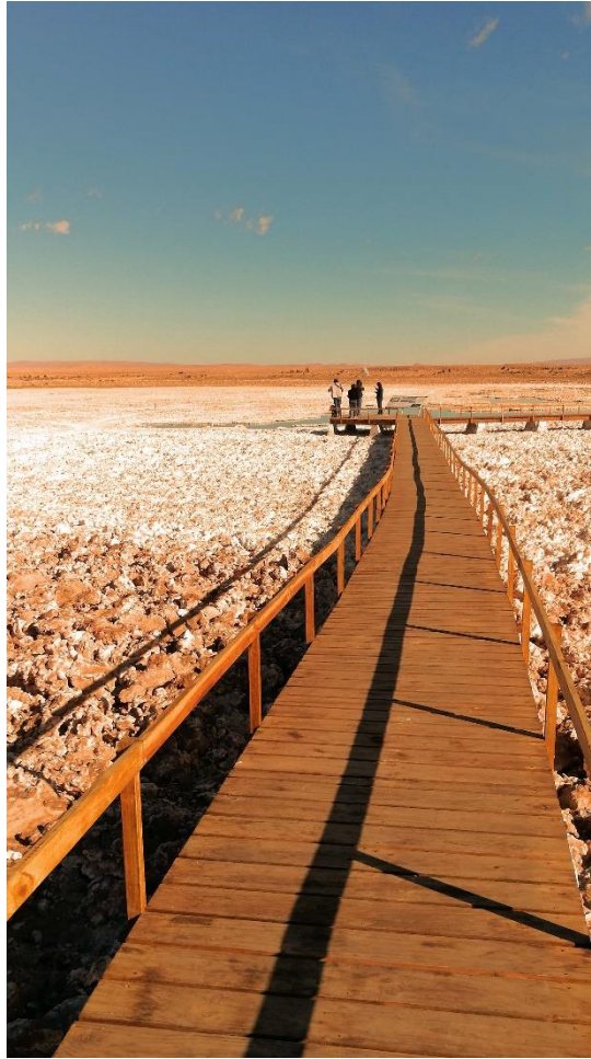
(Figura 7) Plataforma de acceso a las aguas del salar construida por la empresa minera.

“Esto es una aberración! Esto es una aberración!”, fue la frase repetida una y otra vez por distintos miembros del equipo enfrentados a estas transformaciones con sus señaléticas y plataformas. Cristina, mientras leía las nuevas señales, con cierto sarcasmo e irritación enfatizaba lo absurdo que era usar la palabra ‘conservación’ en un lugar que estaba siendo destinado a actividades mineras que explotaban las aguas del salar y del acuífero.