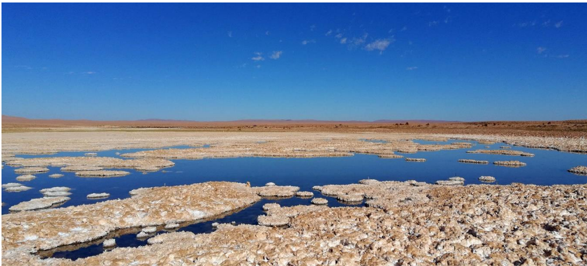
(Figura 5). Salar de Llamara

La cuenca de la Pampa del Tamarugal en el pasado tuvo bosques de tamarugos, los cuales -al ser utilizados como fuente de energía del extractivismo pasado- fueron casi extintos (Castro 2020). La leña y el carbón obtenido del tamarugo se usaba para obtener la energía de la actividad industrial de la plata, el salitre, y era usado como energía para los puertos guaneros de la región de Tarapacá durante los siglos XIX y XX.