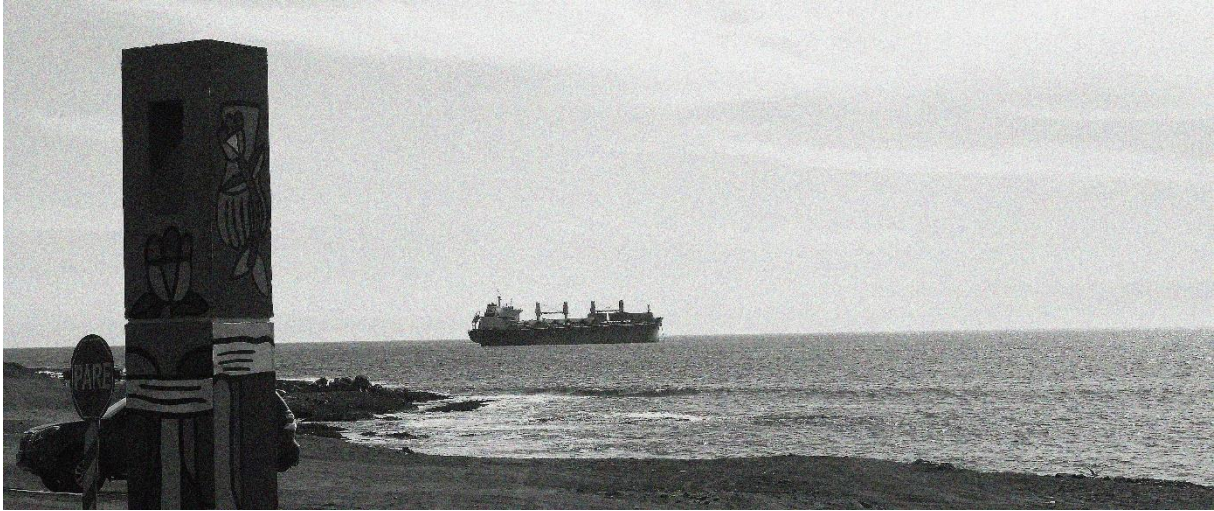
(Figura 1). Barco con minerales alejándose de la costa de Antofagasta, observado desde el memorial dedicado a las víctimas de la dictadura chilena ejecutadas por la ‘caravana de la muerte’ en Antofagasta

Tomamos esta foto en una tarde del 2018, después de haber visitado Coloso, un puerto al sur de Antofagasta desde donde inmensas cantidades de concentrado de cobre son drenadas antes de ser exportadas. Cuando íbamos de vuelta a Antofagasta, hicimos una parada en el memorial dedicado a las víctimas de la dictadura chilena ejecutadas por la ‘Caravana de la muerte’, una comitiva armada del Ejército de Chile que sobrevoló Chile de sur a norte entre el 30 de Septiembre y el 22 de Octubre de 1973.