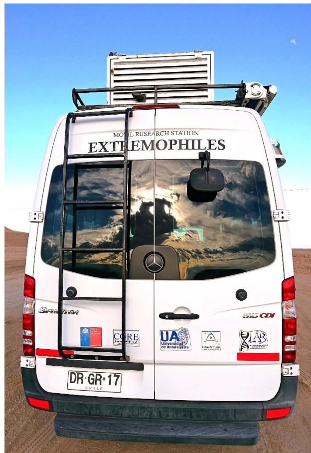
(Figura 4). Laboratorio de investigación móvil sobre extremófilos.

Entre los distintos viajes que hemos realizado a distintos salares desde que nos conocimos, quisiéramos concentrarnos en un evento particular que ocurrió cuando visitamos el Salar de Llamara, un ecosistema salino muy frágil ubicado en el corazón del desierto de Atacama, en la Pampa del Tamarugal, territorio donde también se desarrolló la industria extractivista del salitre a principios del siglo XX. El nombre del lugar proviene del Tamarugo, un árbol nativo del desierto que obtiene agua desde napas subterráneas y que está altamente adaptado a las condiciones ambientales de la zona. Estos árboles tienen en sus raíces unos nódulos con