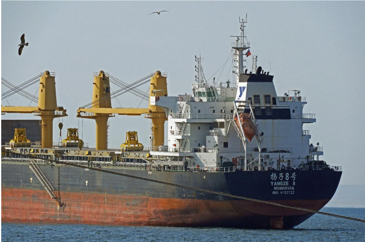
(Figura 3). Close up al barco con nombre en mandarín.

Aunque no tenemos espacio en este trabajo para desarrollar un recuento histórico de las relaciones económicas entre China y Chile, vale la pena mencionar que durante los años 80, la República China -en concordancia con sus reformas económicas del 1978-, reactivó relaciones comerciales con la dictadura chilena. Los líderes chinos estaban particularmente interesados en el proyecto económico Chileno, que ellos consideraron como una exitosa liberalización de la economía sin democratización política. 6 Por ejemplo, la dictadura militar privatizó las aguas chilenas, transformándose en un líder internacional en políticas de agua pro-mercado. El código de agua de 1981 introdujo una separación radical entre la tierra y el agua, definiendo al agua como propiedad privada sin regulación estatal significativa. Este código ha gatillado problemas de desigualdad, conflictos entre usuarios de agua, y un crisis ambiental severa. 7