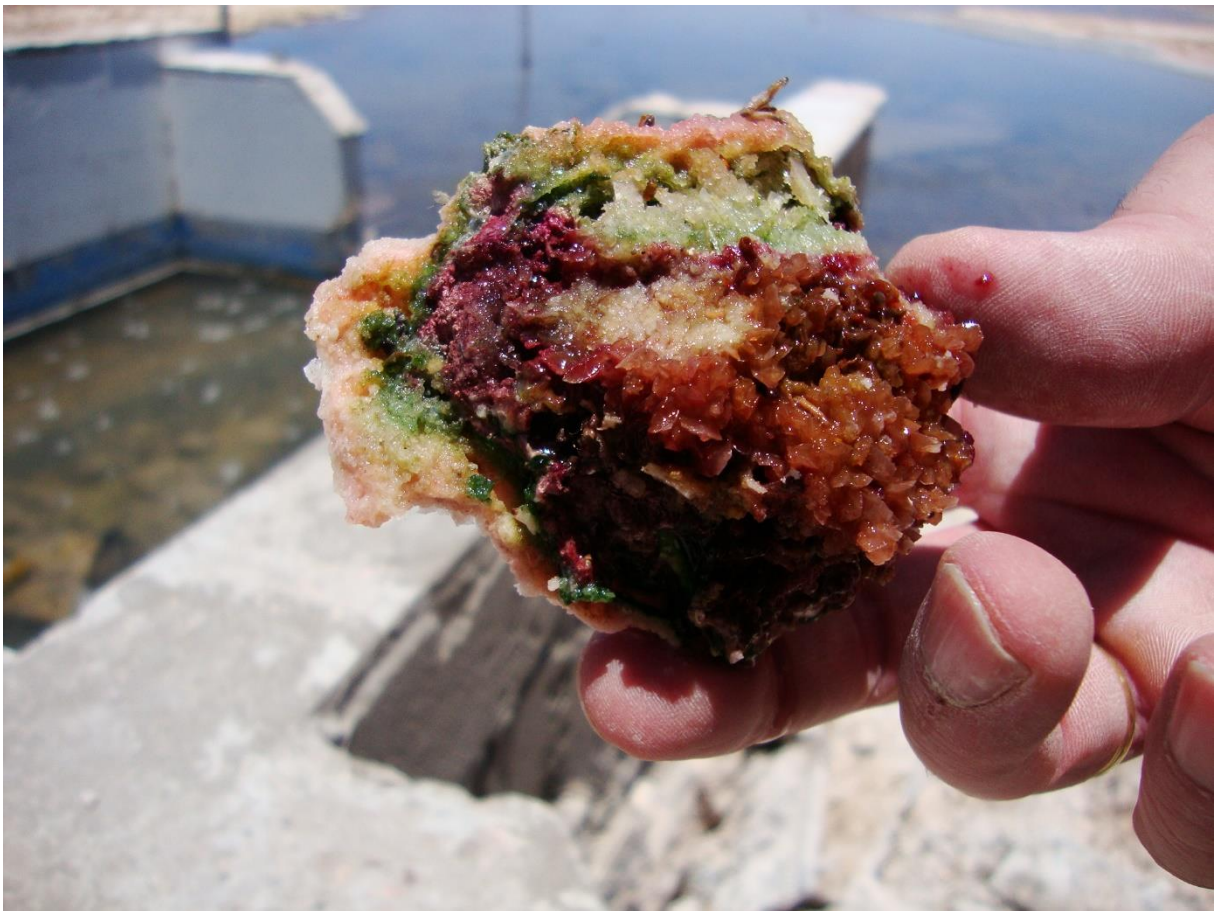
(Figura 13). Colorido tapete microbiano.

Teniendo en cuenta lo dicho sobre los microorganismos, podemos ahora apreciar mejor a un tapete microbiano en condiciones típicas.