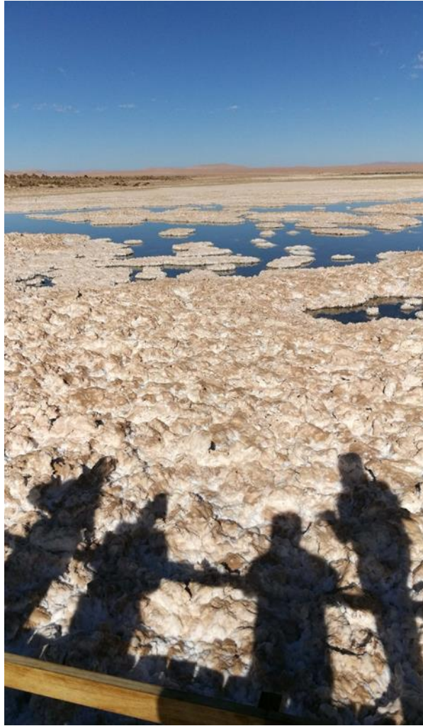
(Figure 10). Una conversación ‘terapéutica’ en el salar

Cuatro años más tarde, sin embargo, nos hemos dado cuenta que esta broma de Cristina (‘hemos hecho psicoterapia!’), expresaba de alguna manera lo que hemos llegado a pensar como un afecto de tiempo-profundo , un tipo de afecto que conecta el tiempo histórico con las escalas temporales del tiempo evolutivo biológico, un tipo de afecto que, además, cuestiona fuertemente cierto tipo de naturalismo patriarcal que prohíbe dar espacio a las emociones dentro de sus descripciones científicas. El ser testigos de cómo el archivo microbiano de tiempo-profundo sobre el Gran Evento de Oxigenación estaba siendo alterado por la actividad extractivista nos invitaba no solamente a repensar la psicoterapia -al traer el tiempo de la evolución biológica a la vida cotidiana!-, sino que también nos obligaba a repensar la reparación ecológica desde temporalidades de procesos planetarios que excedían al tiempo histórico humano.