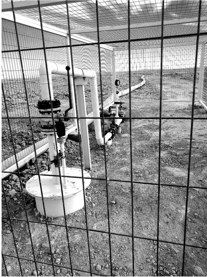
(Figure 11). Tuberías mineras en el salar de Llamara

Pesquisas preliminares indican que las aguas del Salar de Llamara son extraídas y transportadas unos 8 kilómetros al norte del salar, donde son usadas para disolver rocas de ‘caliche’, de las cuales se producen tipos diferentes de nitratos que son usados para hacer sales solares, y en definitiva, ‘energía limpia’. Estas sales, a su vez, son puestas a trabajar para el almacenamiento termal y la transferencia de calor en plantas termosolares de concentración (CSP). De hecho, en el medio del Desierto de Atacama, está comenzando sus operaciones la planta concentradora termosolar de Cerro Dominador, la más grande de Latinoamérica y que tiene una capacidad de 110 KMW y 17,5 horas de almacenamiento termal. Su torre principal tiene una altura de 220 metros, por lo cual es posible verla desde distintos puntos del desierto. Las sales necesarias para su funcionamiento son principalmente nitrato de potasio y cloruro de sodio, sales abundantes en el Desierto. Las sales de potasio se obtienen desde las salmueras del Salar de Atacama (donde además se encuentran las empresas de litio más grandes del planeta); y las sales de nitrato de sodio (salitre) son obtenidas desde los depósitos de caliche