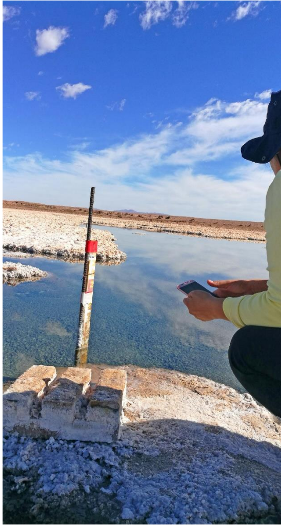
(Figure 8). Palito usado para medir el nivel de las aguas.