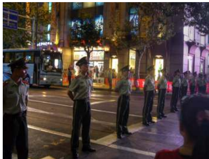
China is politiek gezien onvrij.