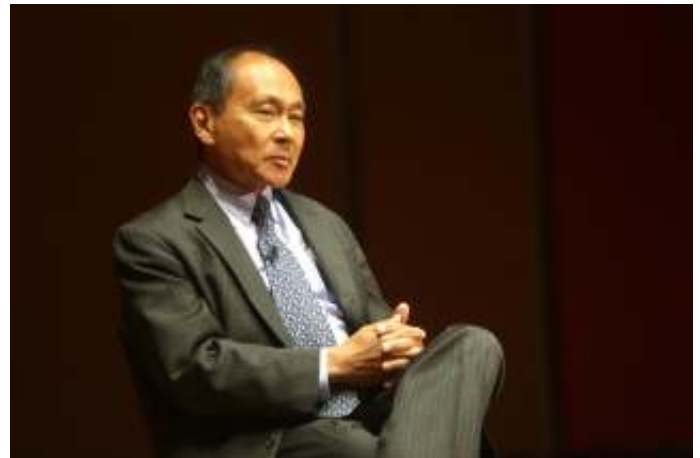
Francis Fukuyama.

De onbereikbaarheid van het ideaal bleek na verloop van tijd de achilleshiel van het systeem. Er waren aan het eind van de rit nog maar weinig communisten die in dit ideaal geloofden. Als gevolg hiervan verschrompelde ook de internationalistische communistische beweging, die aanvankelijk het communisme agressief wereldwijd promootte. Verzet tegen de onderdrukking, verzet tegen mensenrechten- en burgerrechtshendingen werd militair hard neergeslagen. De opstanden in Hongarije 1956, Tsjecho-Slowakije 1968 en de staat van beleg in Polen in 1980 waarvan slechts 'socialisme met een menselijk gezicht', een soort derde weg tussen het kapitalisme en communisme de inzet was, eisten dodelijke slachtoffers. Vele burgers probeerden aan het systeem te ontsnappen door naar het Westen te vluchten, wat in sommige gevallen met veel gevaar voor eigen leven ook lukte. Het systeem