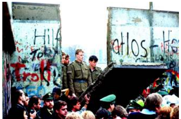
In 1989 stortte het communisme in elkaar.