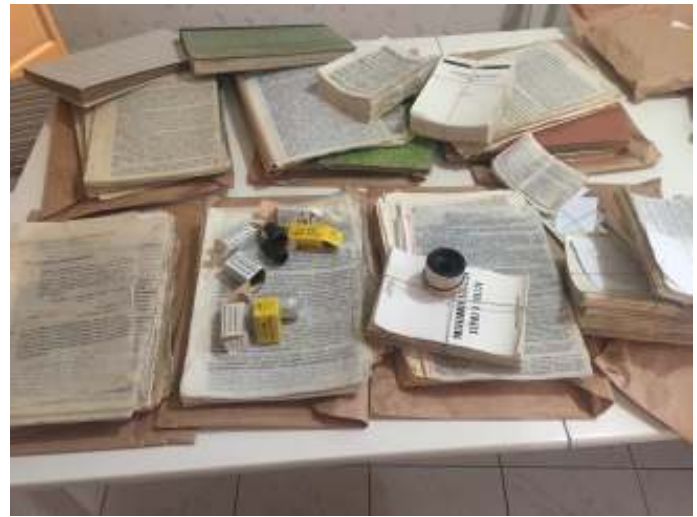
Voorbeelden van literatuur (op de fotorolletjes) en boeken die in het geheim werden gepubliceerd, de zogeheten Samizdat.