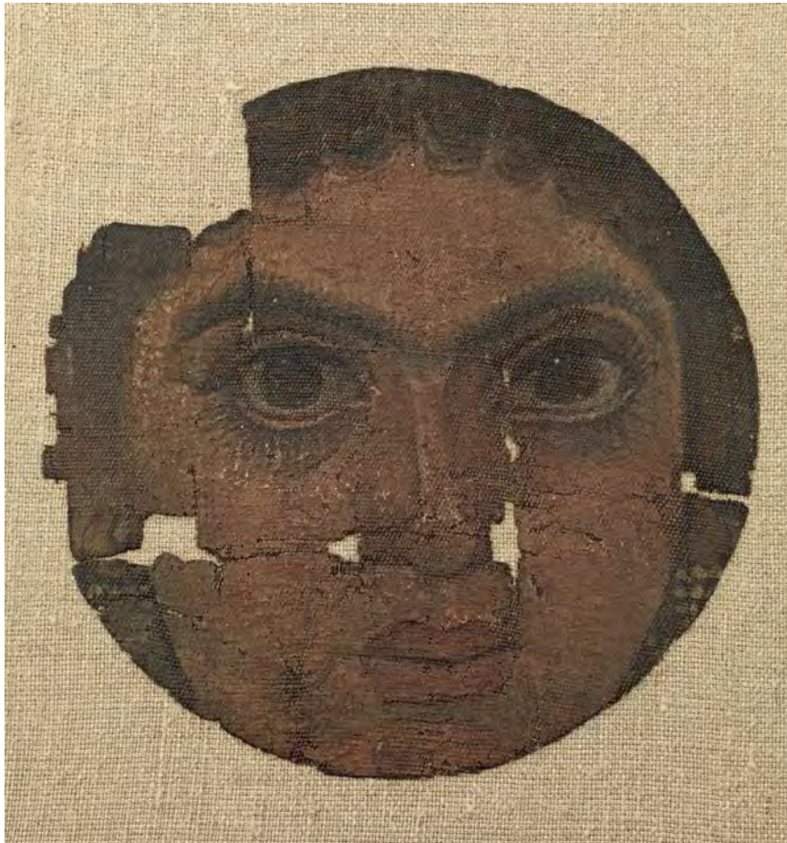
Mummieportret van een jonge vrouw. Tempera op linnen, ø 14 cm. Egypte, tweede eeuw n.Chr. Allard Pierson, UvA, APM 8133.

ren. Het APPEAR-project van het J. Paul Getty Museum in Los Angeles biedt al veel perspectief. 5 We hopen die inzichten en nieuwe narratieven over mummieportretten over enkele jaren te kunnen presenteren in een tentoonstelling waarin deze dame op een linnen lijkwade dan ook in een nieuw daglicht kan worden geplaatst.