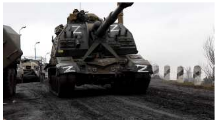
In de Oekraïens-Russische oorlog is Rusland duidelijk de agressor.

Hongarije ziet de oorlog als een Slavische broederstrijd waar het buiten moet blijven