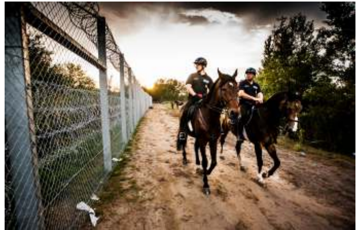
De Visegrád-samenwerking was de afgelopen jaren vooral succesvol in de beperking van illegale migratie naar Europa.

Drie dagen na de eclatante verkiezingsoverwinning van premier Orbán verstuurd de voorzitter van de Europese Commissie (EC), Ursula von der Leyen een brief aan de Hongaarse regering waarin aangekondigd werd dat Hongarije gekort gaat worden op haar financiële steun uit Brussel wegens het schenden van de rechtsstaat en corruptie. Zoals al vaker gebleken is, zijn de klachten van de EC in dergelijke dossiers vaag en zal hoogstwaarschijnlijk blijken dat er weinig aan de hand is, maar dat de EC een tijdje wel de druk op een 'afvallig' Midden- of Oost-Europees land kon opvoeren. Diezelfde EC die een land in oorlog, Oekraïne, een kandidaat-lidmaatschap al in juni wil toekennen. Destijds in de Joegoslavië-crisis in de jaren negentig werden landen in de regio buiten de EU-deur gehouden met het argument dat landen verwickeld in gewapende conflicten eerst hun conflicten moesten oplossen, om daar de EU niet mee te belasten. De EU zou in dergelijke situaties partij kunnen worden en dat moest te allen tijde worden uitgesloten, luidde de redenering. Het lijkt erop dat de-escalatie nu niet meer de norm is in Brussel en dat de EC wil dat de EU deelgenoot wordt in de Oekraïens-Russische oorlog.