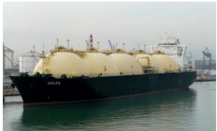
Ook de Amerikaanse LNG-capaciteit is onvoldoende om heel Europa van gas te voorzien.