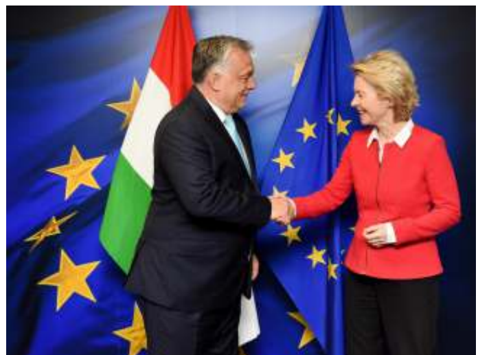
Viktor Orbán en EC-voorzitter Ursula von der Leyen. De relatie tussen Hongarije en de Europese Commissie is problematisch.