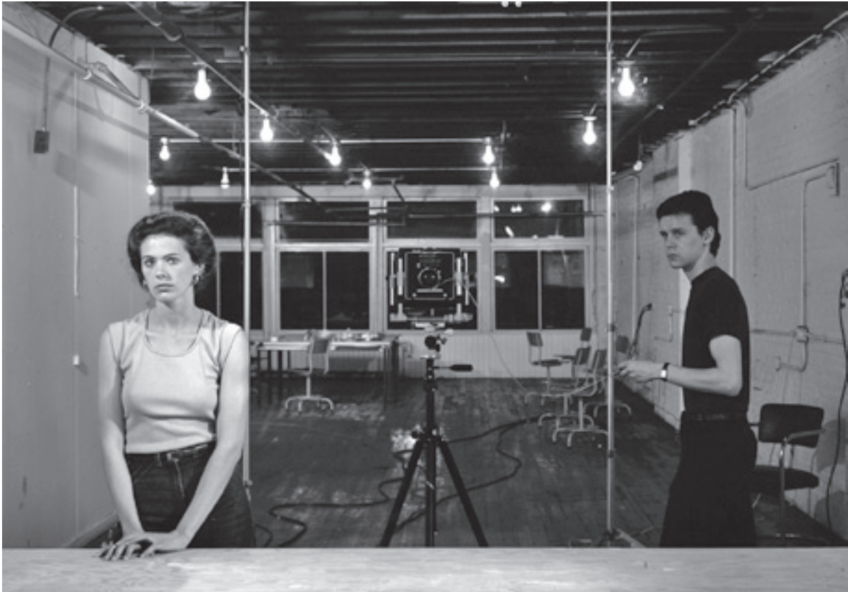
Jeff Wall, 'Picture for women' (1979). Bij histoire croisée komt de auteur zelf in beeld.