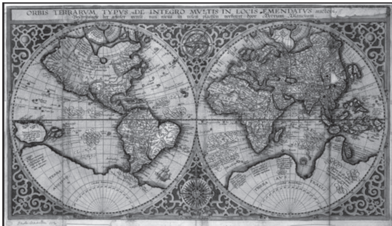
Orbis terrarum typus, Plancius, 1590.