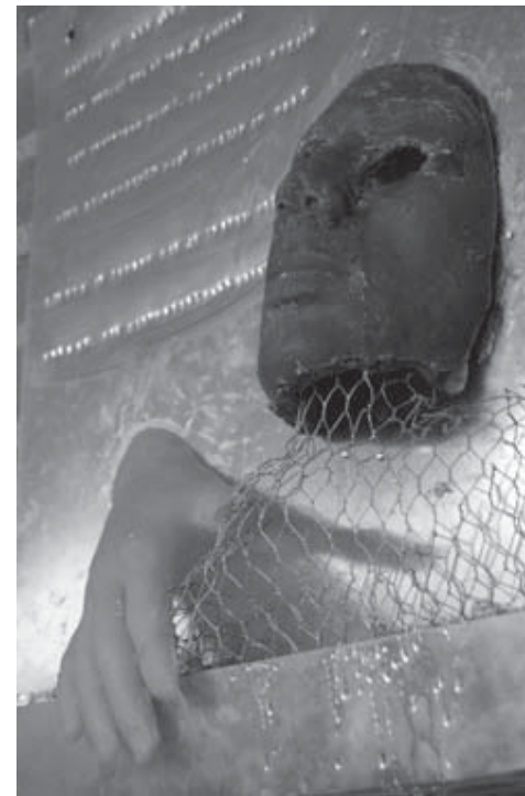
Leerlingenwerk klas 3: Ignaz Kevenaer Afbeelding door Ignaz Kevenaer gemaakt met Adobe Photoshop