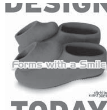
Dancing shoes for Father and Daughter Omslag boek Forms with a smile

We hebben meteen een aantal oefeningen gedaan in divergent denken. De spaghettitest (bedenk in vijf minuten zoveel mogelijk originele mogelijkheden wat je met spaghetti kunt doen, gekookt en ongekookt) viel erg in de smaak: het was ongelooflijk hoeveel verschillende en originele toepassingen leerlingen konden bedenken. Daarna wisselden zij in duo's uit aan elkaar (daarbij zag je een hele klas vol met glimlachende gezichten) en werden de meest originele toepassingen klassikaal nog eens genoemd. Daarmee werd officieel vastgesteld dat leerlingen goed divergent konden denken! Ze verbaasden zich er zelf over. En dus kwam opdracht twee: Noem zoveel mogelijk originele mogelijkheden met betrekking tot het thema Liefde . Dat leidde tot veel gelach, maar tot ook veel