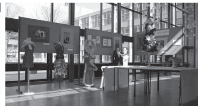
Leerlingenwerk klas 3 expositie Met Liefde gemaakt

gezichten met vraagtekens, want liefde was volgens hen toch iets heel anders dan spaghetti. Uiteindelijk durfden leerlingen toch te gaan associëren, en daarbij kwamen al heel originele voorbeelden.