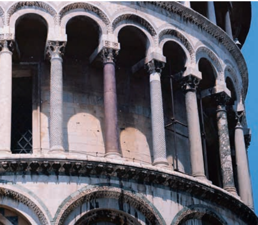
2. Dom van Pisa, spolia-zuilen in de dwerggalerij van de apsis