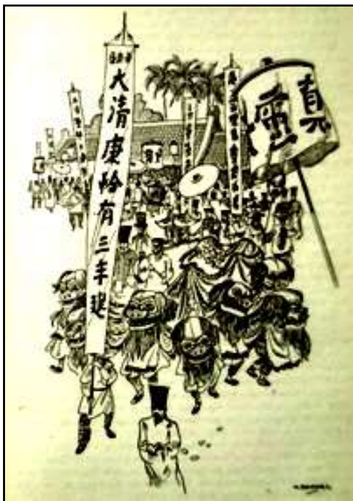
De zevenkoppige draak 134

Een reusachtige papieren zevenkoppige draak wordt in de stoet meedragen, de zeven bekken klappen onophoudelijk open en dicht. Alleen de staart al moet door zeven mannen gedragen worden. De mannen van de schepen hebben er plezier om. Ze slaan zich op de dijnen van de pret, maar de heren van de kerkeraad keuren deze 'afgoderij' niet goed. 'Het komt niet te pas, in een calvinistische stad zulke buitensporigheden te bedrijven'. 133