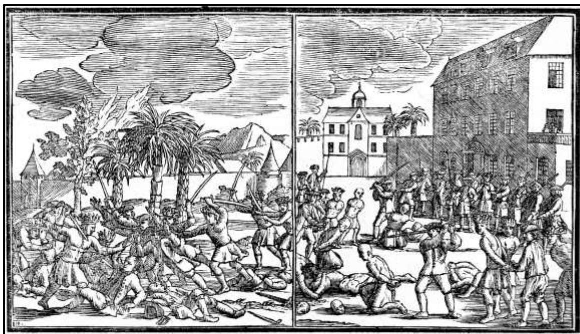
Middels deze prent wil de tekenaar laten zien hoe het er in 1740 aan toeging in de Ommelanden, waar de Chinese rebellen de Nederlandse soldaten vermoordden (links) en in Batavia, waar de stads-Chinezen zich als ‘willooze lammeren’ lieten afslachten 56

Chinezen uit de Ommelanden vielen versterkte posten in Tangerang en Bacassy aan en vermoorden de aldaar geplaatste detachementen. Het werd iedereen verboden ‘op straffe van de ketting’ de Chinezen binnen de stad lastig te vallen, zodat zij hun kostwinning konden voortzetten. Maar op 8 oktober werd aangekondigd dat de Chinezen van buiten Batavia de stad niet binnen mochten en dat de Chinezen binnen Batavia hun vrouwen er niet uit mochten voeren. Chinezen die zich buiten de stad lieten zien en weigerden hun wapens af te geven of weerstand boden, zouden worden neergeschoten. Er werd een avondklok aangekondigd. Buiten de stad was het onrustig. De Chinezen buiten Batavia deden verschillende aanvallen. Op Tanabang werden ze zonder moeite verslagen. 55