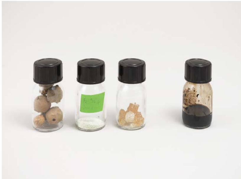
Afbeelding 5. De voornaamste bestanddelen voor de bereiding van ijzergallusinkt