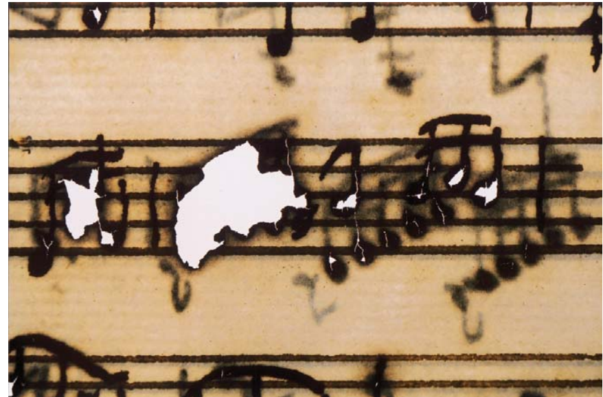
Afbeelding 8. Staatsbibliothek zu Berlin, Musikabteilung, Weihnachtsoratorium , Johann Sebastian Bach, Autograph, 1734, vóór behandeling