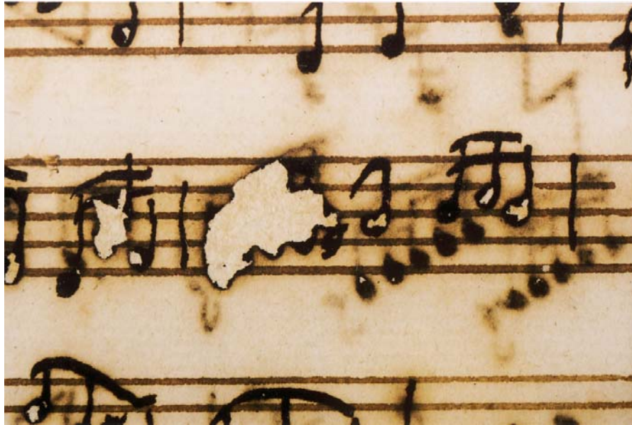
Afbeelding 9. Staatsbibliothek zu Berlin, Musikabteilung, Weihnachtsoratorium , Johann Sebastian Bach, Autograph, 1734, na behandeling

Jos A. A. M. Biemans – Brand van binnenuit