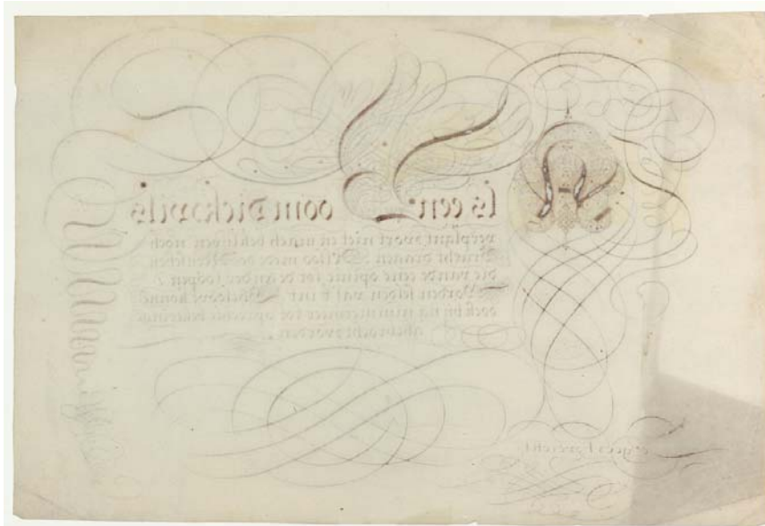
Afbeelding 3. Universiteitsbibliotheek Amsterdam (UvA), Bijzondere Collecties, Verzameling Kalligrafie