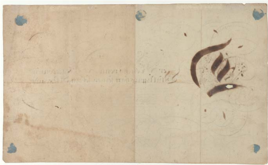
Afbeelding 7.