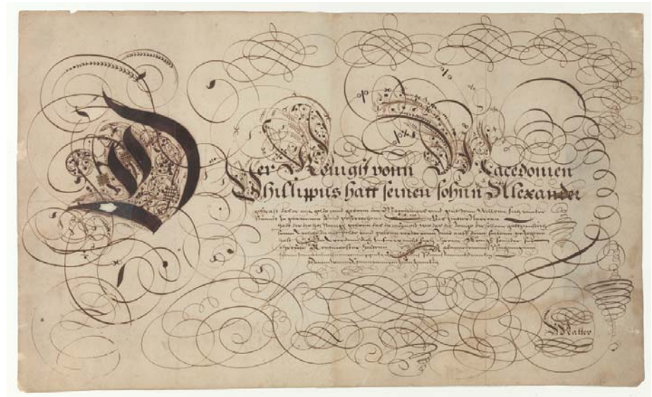
Afbeelding 6. Universiteitsbibliotheek Amsterdam (UvA), Bijzondere Collecties, Verzameling Kalligrafie