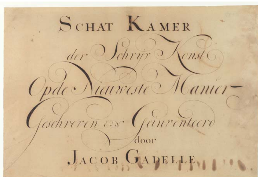
Afbeelding 1: Universiteitsbibliotheek Amsterdam (UvA), Bijzondere Collecties, Verzameling Kalligrafie. 'SCHAT KAMER der Schrijf Kunst Op de Nieuwste Manier Geschreven EN Geïventeerd door JACOB GADELLE.'

© De Creative Commons Licentie is van toepassing op dit artikel (Naamsvermelding-Niet-commercieel 3.0). Zie http://creativecommons.org/licenses/by-nc/3.0/nl voor meer informatie.