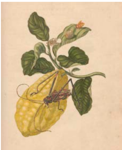
Plaat 28 uit Maria Sibylla Merian, Over de voortteeling en wonderbaerlyke veranderingen der Surinaemsche insecten , Amsterdam 1719. Artis Bibliotheek, Bijzondere Collecties, Universiteit van Amsterdam.

voorziet onder meer in een grote behoefte door correcte transcripties te bieden van de achttien brieven die Merian vanuit Frankfurt, Neurenberg en Amsterdam schreef. Tevens geeft de website een helder overzicht van alle werken van Merian in verschillende edities en zijn er links naar de online versies van deze edities op internet. Dit is handig voor vergelijkend boek-historisch onderzoek.