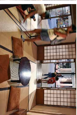
Overgangene En av de mest spektakulære objektene man kan få se på Edo-Tokyo-museet, er en replika av broen Nihombashi, som ledet inn til den gamle hovedstaden Edo på 1600-tallet.