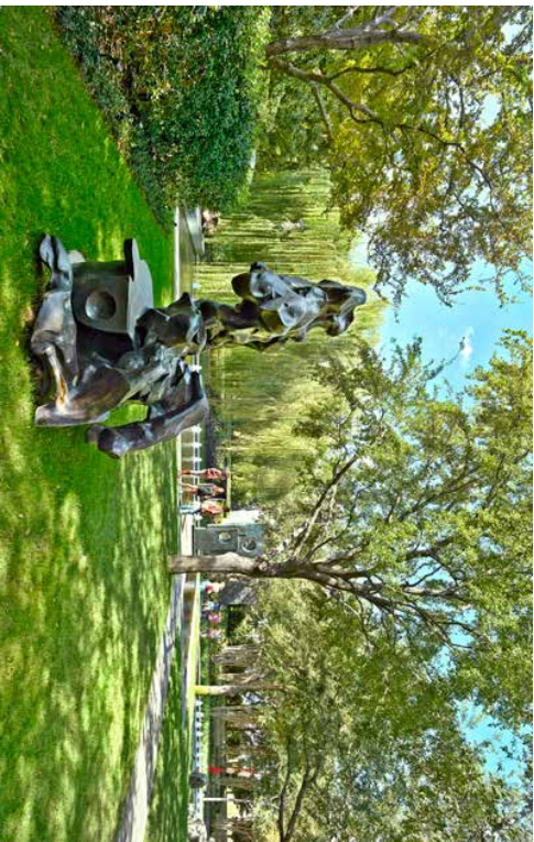
Oase i sentrum Nasher Sculpture Center i Dallas i USA er tegnet av Renzo Piano i samarbeid med landskapsarkitekten Peter Walker. Blant de mest kjente skulptørene som er utsifli, kan man finne Picasso, Giacometti og Rodin.