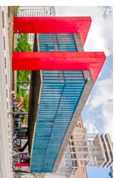
Røft uttrykk MASP regnes som en av de viktigste kulturstruksjonene i Latin-Amerika, og et av de viktigste eksemplene på Brasils rike arkitektoniske arv innen modernismen. Den røffe, behandlede fasaden er brakt i harmoni med helheten, som uttrykkes i letthet og transparens. Bygget er tegnet av Lina Bo Bardi.