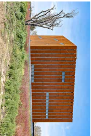
Troja i fire etasjer Fra taker på Det trojanske museet, ikke langt fra Istanbul, kan man skue ut over det anatolske landskapet der den trojanske krigen – Høige Legenden – ble utførelst for over 3000 år siden.