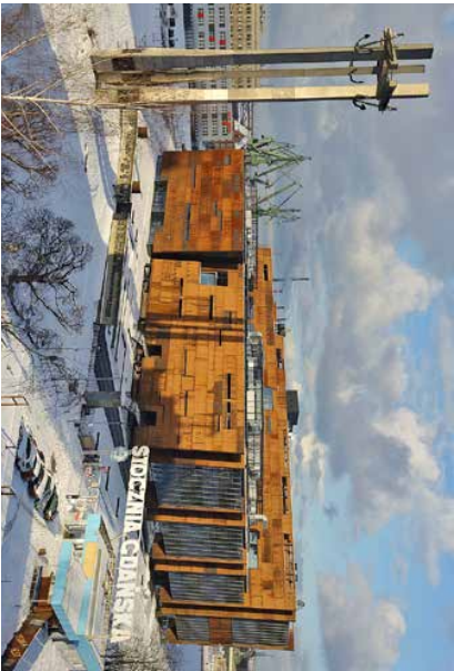
European Solidarity Center Gdansk, Polen

I august 1980 gikk arbeiderne ved Polens største skipsverft i Gdansk, til streik med krav om økt frihet og flere rettigheter. Under ledelse av Lech Walesa klarte de å etablere fagforeningen Solidarnosc (Solidarros), som var den første lille sprøkket i Jerntappet, og som endte med at hele Østblokken – med sitt kommunistiske system – denses i bakken. Ved siden av verftet finner man i dag et museum, The European Solidarity Center, som åpnet i 2014. Det er viet til den polske fagforeningen og andre østeuropøiske